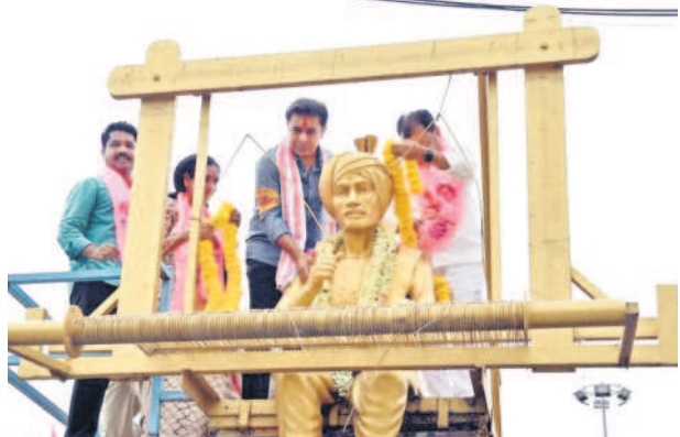
సిరిసిల్ల పాతబస్టాండ్ లోని నేతన్న విగ్రహానికి పూల మాల వేస్తున్న మంత్రి కేటీఆర్