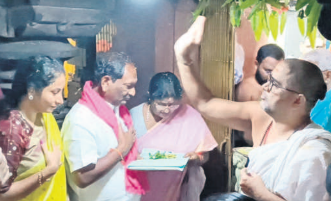
ధర్మపురి: ధర్మపురి లక్ష్మీనరసింహస్వామి ఆలయంలో కుటుంబసమేతంగా పూజలు నిర్వహిస్తున్న మంత్రి కేశవ్