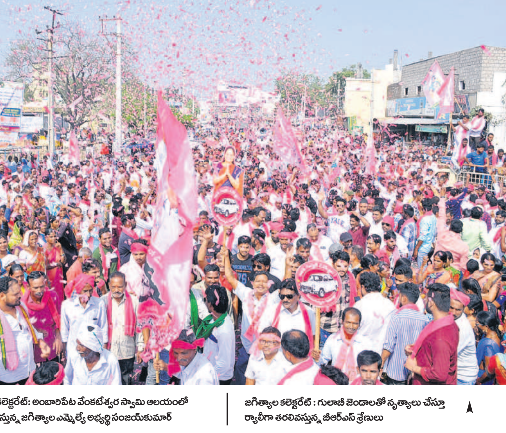
జగిత్యాల కలెక్టరేట్: గులాబీ జెండాలుతో స్వామి ఆలయం చేస్తూ ర్యాలీగా తరలివస్తున్న జిల్లాలోని ఎమ్మెల్యే శ్రీధర్