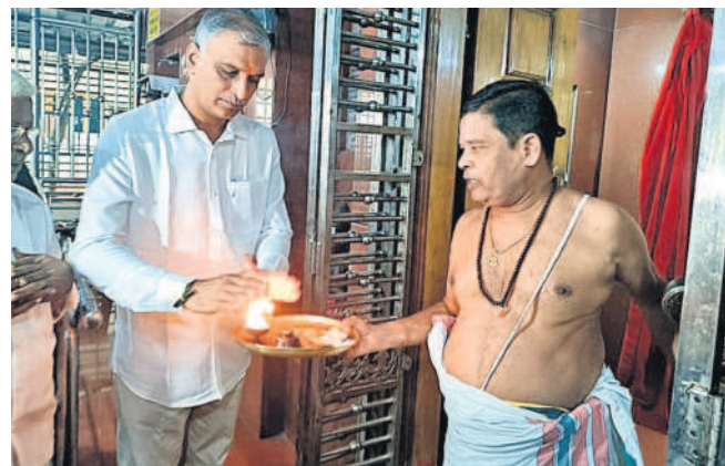
సిద్దిపేట మెహినపురా వేంకటేశ్వరస్వామి ఆలయంలో పూజలు చేస్తున్న మంత్రి తన్నీరు హరీశ్ రావు