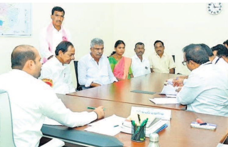
గజ్వేల్ లిబరల్స్ అధికారి కార్యాలయంలో మాట్లాడుతున్న సీఎం కేసీఆర్