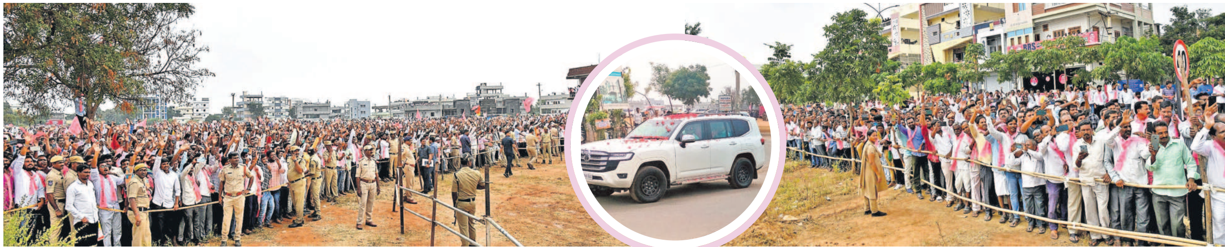
గజ్వేల్లో సీఎం కేసీఆర్ ను చూసి నినాదాలు చేస్తున్న బీఆర్ఎస్ నాయకులు, కార్యకర్తలు