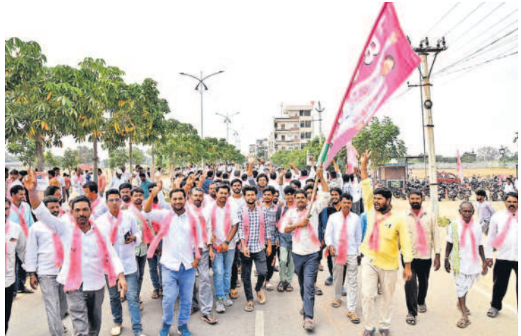
గజ్వేల్లో ర్యాలీగా వస్తున్న కార్యకర్తలు

సీఎం కేసీఆర్ కు ఘన స్వాగతం పలికిన ప్రజాప్రతినిధులు గజ్వేల్ అసెంబ్లీ స్థానానికి నామినేషన్ చేసేందుకు వచ్చిన సీఎం కేసీఆర్ కు పార్టీ శ్రేణులు ఘనంగా స్వాగతం పలికారు. హెలికాప్టర్లో గజ్వేల్ కు చేరుకొని నామినేషన్ చేసేందుకు అందజేశారు. అనంతరం హెలికాప్టర్ వద్దకు చేరుకున్న సీఎం కేసీఆర్ కు గజ్వేల్ నియోజకవర్గ ప్రజాప్రతినిధులు ఘనంగా స్వాగతం పలికారు.