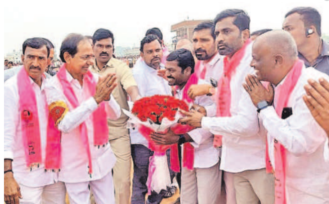
గజ్వేల్లో సీఎం కేసీఆర్ కు స్వాగతం పలుకుతున్న నాయకులు