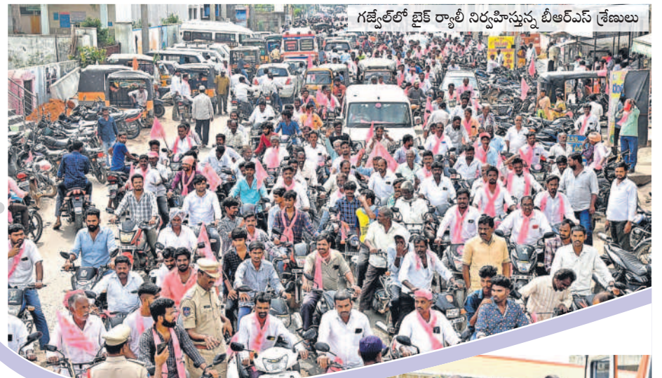
గజ్వేల్ లో టైక్ ర్యాలీ నిర్వహిస్తున్న బీఆర్ఎస్ శ్రేణులు