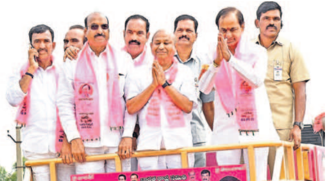
గజ్వేల్ లో ప్రచార రథంపై ప్రజలకు అభివాదం చేస్తున్న సీఎం కేసీఆర్

గజ్వేల్ పట్టణం గులాబీమయమైంది. గులాబీదండు గుబాళించింది. టైక్ ర్యాలీలతో రోడ్లన్నీ కిక్కిరిసిపోయాయి. గురువారం ఉదయం ఎర్రపల్లిలోని వ్యవసాయ క్షేత్రం నుంచి సీఎం కేసీఆర్ హెలికాప్టర్లో గజ్వేల్ కు చేరుకున్నారు. తర్వాత సీఎం కేసీఆర్ ప్రత్యేక కాన్వాయ్ లో ఐవోసీ కార్యాలయంలోని రిటర్నింగ్ అధికారి కార్యాలయానికి వెళ్లి గజ్వేల్ అసెంబ్లీ స్థానానికి రెండుసెట్లు నామినేషన్ పత్రాలను దాఖలు చేశారు. అనంతరం హెలికాప్టర్ వద్దకు చేరుకున్న సీఎం కేసీఆర్ కు నియోజకవర్గ ప్రజాప్రతినిధులు పుష్పగుచ్ఛాలు అందజేసి ఘన స్వాగతం పలికారు. ప్రచార రథంపై నుంచి సీఎం కేసీఆర్ ప్రజలకు అభివాదం చేశారు. హ్యూట్రీక్ సీఎం కేసీఆర్, కేసీఆర్ జిందాబాద్, టైక్ ర్యాలీ అంటూ పెద్దఎత్తున జనం నినాదాలు చేశారు. గ్రామాల నుంచి బీఆర్ఎస్ కార్యకర్తలు, నాయకులు తరలివచ్చారు. సీఎం పర్యటన గులాబీ శ్రేణుల్లో కొత్త జోషును నింపింది.