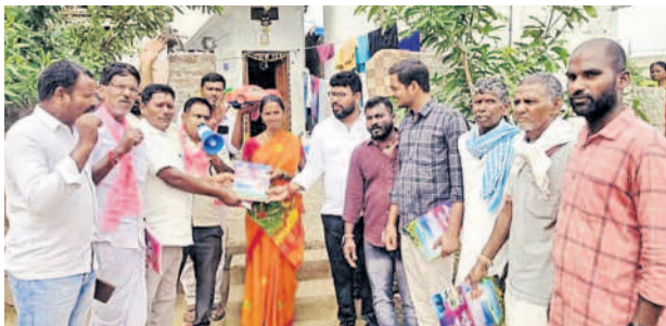
సిద్దిపేట కమాన్ : ఇంటింటి ప్రచారం చేస్తున్న బీఆర్ఎస్ నాయకులు