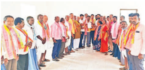
సిద్దిపేట రూరల్ : ఏకగ్రీవ తీర్మానం అందిస్తున్న పుల్లూరు ముదిరాజ్ సంఘం సభ్యులు