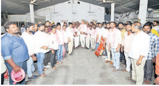
మంత్రికి ఏకగ్రీవ తీర్మాన పత్రం అందజేస్తున్న ఎస్సీ(మాదిగ) సంఘం సభ్యులు