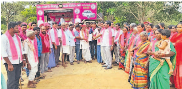
నారాయణరావుపేట: ఏకగ్రీవ తీర్మాన పత్రం అందజేస్తున్న గ్రామస్థులు