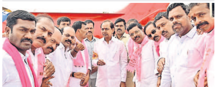
గజ్వేల్ : సీఎం కేసీఆర్ తో ప్రజాప్రతినిధులు, నాయకులు