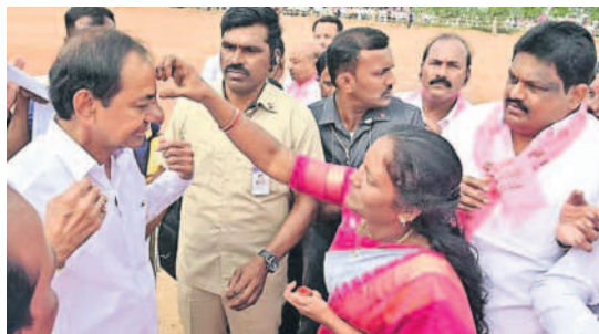
సీఎం కేసీఆర్ కు బొట్టు పెడుతున్న ఎంపీపీ అమరావతి