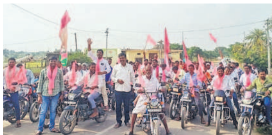
జగదేవ్ పూర్ : సీఎం కేసీఆర్ కు మద్దతుగా గజ్వేల్ కు తరలివెళ్తున్న బీఆర్ఎస్ నాయకులు, కార్యకర్తలు