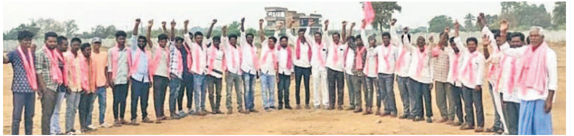
వర్గల్ : సీఎం కేసీఆర్ కు మద్దతుగా సీతారాంపల్లి నుంచి గజ్వేల్ కు తరలివెళ్తున్న బీఆర్ఎస్ నాయకులు