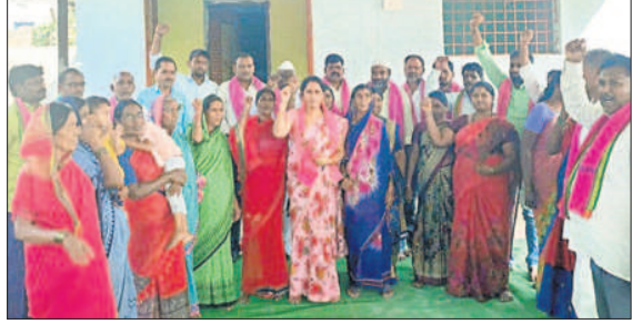
తాడిహత్తుర్ లో ప్రచారం చేస్తున్న బీఆర్ఎస్ నాయకులు