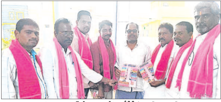
ఎదులాపురం: రాంగర్ లో ప్రచారం చేస్తున్న డీసీసీ బీ చైర్మన్, వార్డు ఇన్ చార్జులు