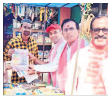
ఆదిలాబాద్ రూరల్ : ఓటు అభ్యర్థిస్తున్న బీఆర్ఎస్ నాయకులు