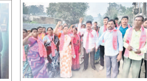
మణుగూరు పట్టణంలో ప్రచారం నిర్వహిస్తున్న బీఆర్ఎస్ శ్రేణులు