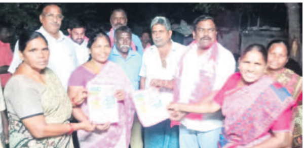
బోసకల్లలో ప్రచారం నిర్వహిస్తున్న బీఆర్ఎస్ నాయకులు

- ఖమ్మం, నవంబర్ 11 (నమస్తే తెలంగాణ ప్రతినిధి)