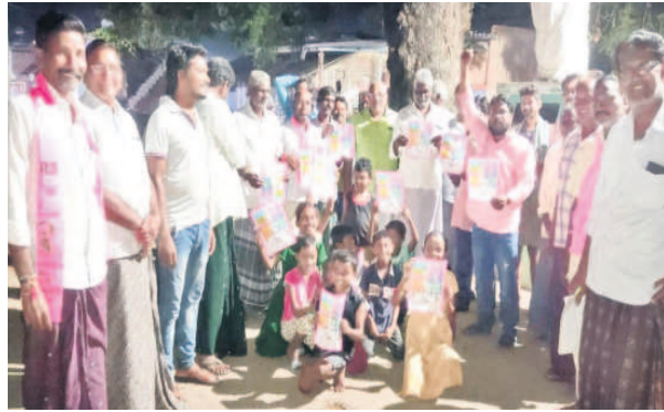
చింతకాని : నాగులవంపలో ప్రచారం నిర్వహిస్తున్న నాయకులు, ప్రజాప్రతినిధులు