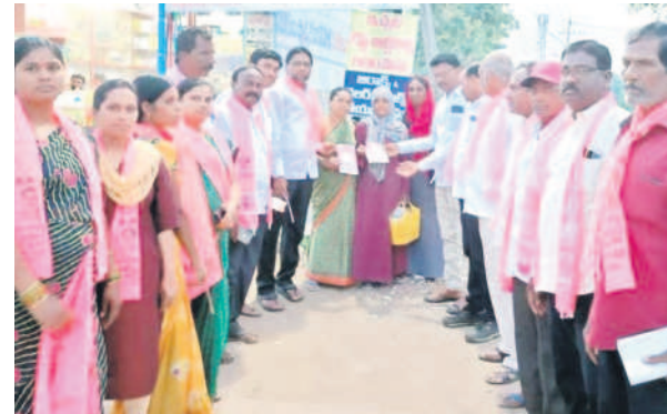
రఘునాథపాలెం : పొందురంగాపురంలో ప్రచారం చేస్తున్న నాయకులు