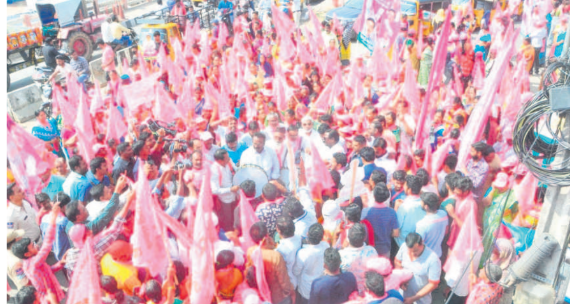
ఖమ్మం : నగరంలో ఎన్నికల ప్రచారం నిర్వహిస్తున్న మంత్రి పువ్వాడ, బీఆర్ఎస్ నాయకులు, కార్యకర్తలు