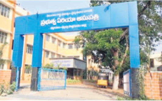
భద్రాచలం ప్రభుత్వ ఆస్పత్రి

నులు ప్రభుత్వ పథకాలను సద్వినియోగం చేసుకుంటూ ఆనందంగా జీవనం గడుపుతున్నారు. అందుబాటులోకి డయాలసిస్ యూనిట్ తెలంగాణ ప్రభుత్వం రూ.3 కోట్ల వ్యయంతో డయాలసిస్ యూనిట్ ను భద్రాచలంలో ఏర్పాటు చేసింది. 10 సిట్టింగ్ లు ఒకసారి జరిగేలా ఇక్కడ మిషన్ ఏర్పాటు చేశారు. ఇప్పటి వరకు 1,200 సార్లు డయాలసిస్ చేశారు. 120 మంది రోగులు వైద్య సేవలు పొందుతున్నారు. ట్రిడ్ నిర్మాణంతో 15 గ్రామాలకు తీలన వెతలు తెలంగాణ ప్రభుత్వం రూ.2.80 కోట్ల వ్యయంతో దుమ్ముగూడెం మండలం కే లక్ష్మీపురం-గోదావరి గ్రామాల మధ్య వంతెన నిర్మాణం చేపట్టింది. దీంతో 15 గ్రామాల ప్రజల రాకపోకల సమస్యకు పరిష్కారం లభించింది. వంతెన నిర్మాణంతో ప్రజల కష్టాలు తీరిపోయాయి. గ్రామాల్లోని గల్లీ రోడ్లను సీస రహదారులుగా మార్చారు. భద్రాచలం పట్టణ పరిధిలోని కాలనీలకు నాడు రహదారి సౌకర్యాల లేక