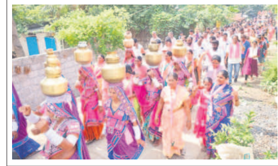
కారపల్లి : ప్రచారంలో భాగంగా గిరిజన మహిళలతో ర్యాలీ