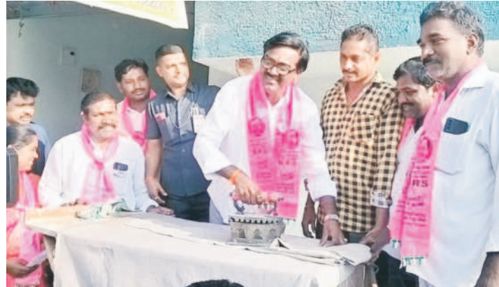
జిన్నీ చేస్తూ.. ఓట్లు అడుగుతూ.. ఖమ్మంలో ప్రచారం చేస్తున్న మంత్రి పువ్వాడ అజయ్