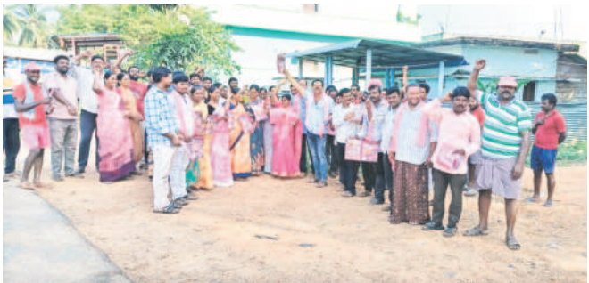
అశ్వారావుపేట రూరల్: వినాయకపురంలో ప్రచారం చేస్తున్న నాయకులు