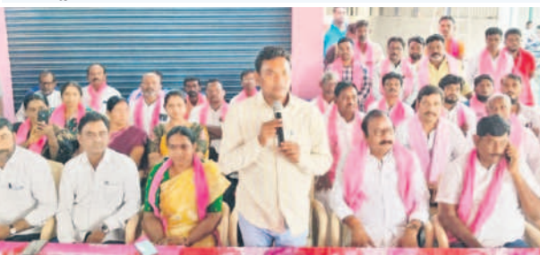
ముఖ్యనాయకులు, ప్రజాప్రతినిధులతో మాట్లాడుతున్న ప్రభుత్వ విప్, ఎమ్మెల్యే రేగా కాంతారావు

లని సూచించారు. ప్రజలను సభకు తీసుకురావడంతోపాటు వారిని క్షేమంగా ఇంటికి చేర్చాలని సూచించారు. సభకు వచ్చే ప్రజలకు ఎలాంటి ఆటంకం కలుగకుండా చర్యలు తీసుకోవాలని, పార్కింగ్, సభా ప్రాంగణం తదితర వాటిపై నాయకులు దృష్టి సారించాలని సూచించారు. కేసీఆర్ ను