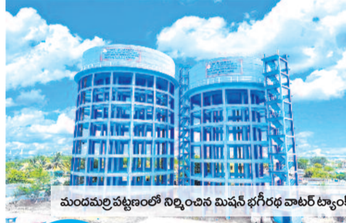
మండవల్లిపట్టణంలో నిర్మించిన మినీ జగిత్యాల వాటర్ డ్యాంక్