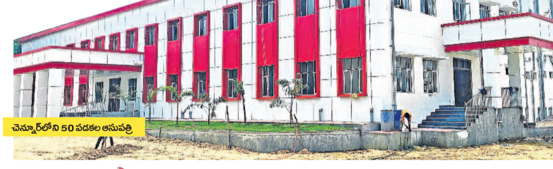
చెన్నూర్ లోని 50 పడకల ఆసుపత్రి