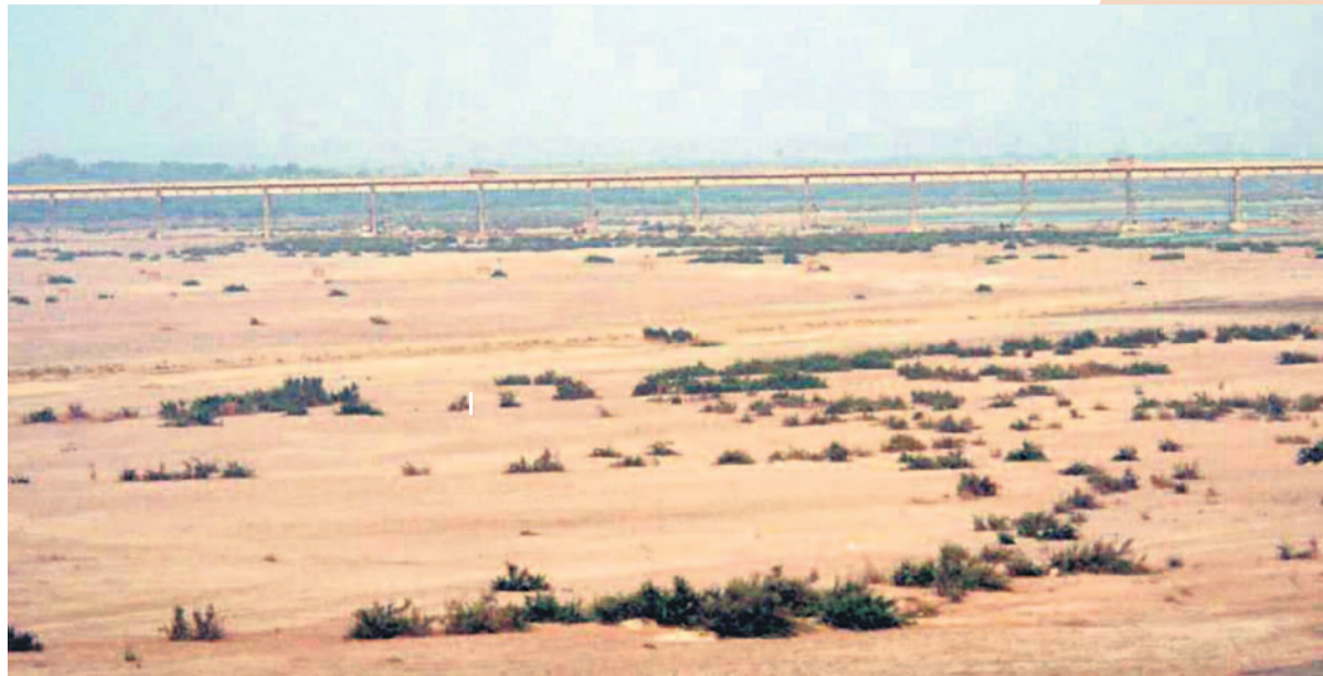
తలాపున గోదావరి ప్రయాణిస్తున్నా.. అనాడు తెలంగాణ గొంతు తడవలేదు. దూరదృష్టి కరువవడంతో ఏటా వేల టీఎంసీల నదీజలాలు నమృదుం పాలయ్యాయి. భారతీగ వర్షాలు కురిసినప్పుడు గోదావరినీ నమీవంలోని నది నీటితో కళకళలాడుతూ కనిపించేది. నెల తిరిగేసరికి ఇదిగో ఇలా ఎడారిని తలపించేది. అఖండ గోదావరి అని పుస్తకాల్లో పదవుకోవడమే కానీ, క్షేత్రస్థాయిలో అందుకు విరుద్ధంగా నీటి జాడలేక పంటకాలువ కన్నా హీనంగా దర్శనమిచ్చేది.