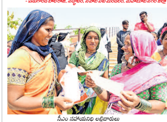
సీఎం సహాయనిభి లభింపజేసిన