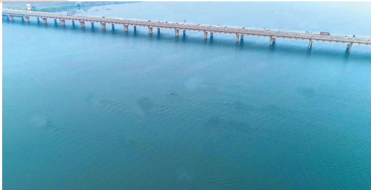
స్వర్ణావళిలో ముఖ్యమంత్రి కేసీఆర్ సంతకంపాలం గో'దావరి నిండుకుండలా మారింది. కాశీశ్రవణం ఎత్తిపోతల పథకం ప్రారంభించిన తర్వాత జయశంకర్ భూపాలపల్లి జిల్లాలోని లక్ష్మీ బర్రాజ్ నుంచి జగిత్యాల జిల్లాలోని దర్శపురి వరకు 190 కిలోమీటర్ల మేర అఖండ గో'దావరి సాక్షాత్కరిస్తున్నది. ఈ మొత్తం పొడవులో 50 టీఎంసీలకు పైగా నీటిని నిల్వ ఉంటాయి. ఏడాదంతా జలసిరి తోటికినలాడటంతో సమీప గ్రామాల్లో భూగర్భ జలాలు పైపైకి చేరుతున్నాయి.