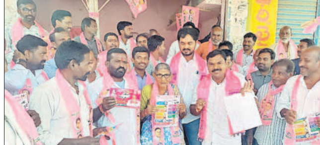
మర్రిపల్లిలో ఇంటింటా ప్రచారం చేస్తున్న బీఆర్ఎస్ నాయకులు