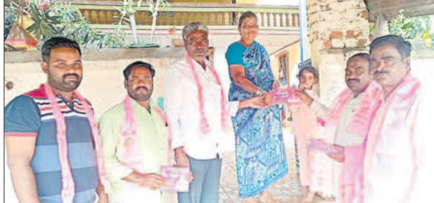
మర్రిపల్లిలో ఇంటింటా ప్రచారం చేస్తున్న బీఆర్ఎస్ నాయకులు