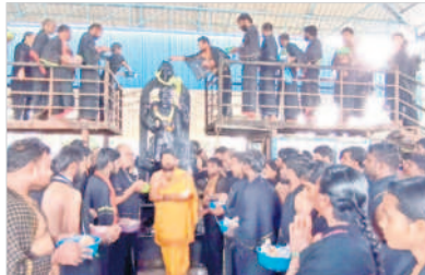
శనైశ్చరుడికి ప్రత్యేక పూజలు చేస్తున్న భక్తులు