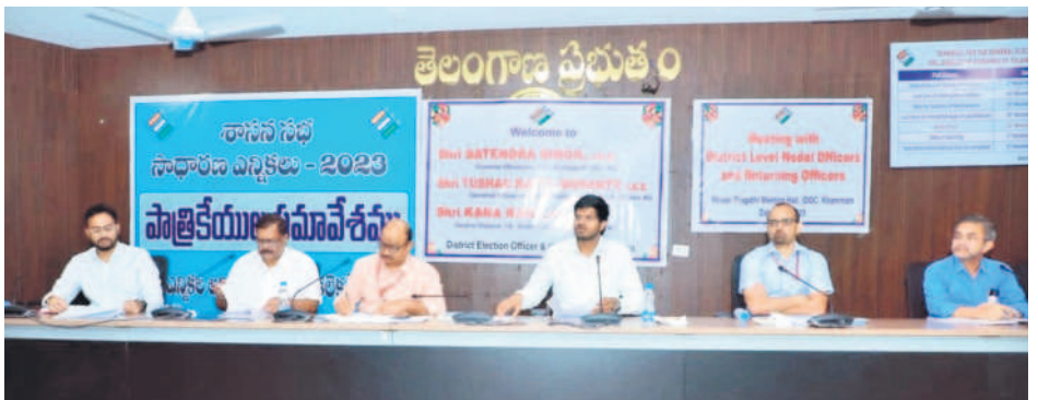
మాట్లాడుతున్న జిల్లా కలెక్టర్ వీపీ గౌతమ్

చామన్నూరు. వీరందరు వారి శిక్షణ సమయం ముగిసిన తరువాత అక్కడే ఏర్పాటు చేసిన బ్యాలెట్ బాక్స్ లో వేయాల్సి ఉంటుందని తెలిపారు. అదేవిధంగా దివ్యాంగులు, వయోవృద్ధుల కేటగిరీలో ఏవీఎస్ 965, ఏవీపీడి 669, ఏవీకాఎస్ 981 మంది నుంచి పోస్టల్ బ్యాలెట్ లో భాగంగా తమ పరిధిలో ఉన్న అర్హత కార్యాలయాలతో పాటు దివ్యాంగులు, వయోవృద్ధుల ఓటర్లు నేరుగా ప్రత్యేక సిబ్బంది ఇంటి వద్దకు వెళ్లి ఓటును వేయించారని తెలిపారు. దీనిని పూర్తి పారదర్శకంగా నిర్వహిస్తామని ప్రత్యేక వాచానంలో ఈవీఎంలను ఏర్పాటు చేసి పూర్తి భద్రతల మధ్య ఓటును వేయించామని తెలిపారు.