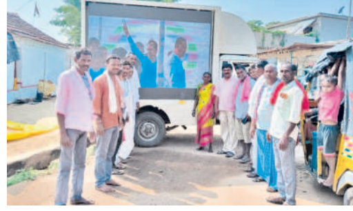
పెద్దకొండమ్మగల్లో ఎల్ఈడీ స్త్రీస్ ద్వారా ప్రచారం నిర్వహిస్తున్న నేతలు