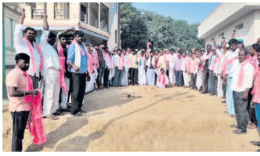
బీఆర్ఎస్లో చేరిన మార్గి గ్రామస్థులు