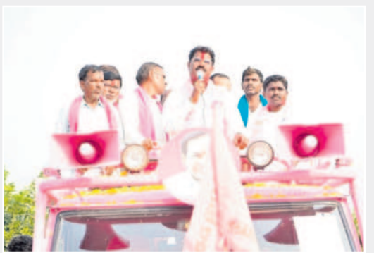
డోన్ గావ్ మాట్లాడుతున్న ఎమ్మెల్యే హస్తాంతరం

నిజాంసాగర్, నవంబర్ 11: 'మీ నియోజకవర్గ బిడ్డను.. ఆశీర్వాదించి గెలిపించండి..' అంటూ జుక్కల్ ఎమ్మెల్యే బీఆర్ఎస్ అభ్యర్థి హస్తాంతరం ఓటర్లను ఆభ్యర్థించారు. జుక్కల్ మండలంలోని నావరగావ్, వజ్రఖండి, సోపూర్, మధుర తండా, డోన్ గావ్, దోస్తపల్లి, బంగారుపల్లి, మైబాపూర్, గుండుూరు, జుక్కల్ గ్రామాల్లో శనివారం ఎన్నికల ప్రచారం నిర్వహించారు.