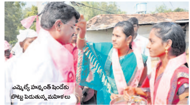
ఎమ్మెల్యే హస్తాంతరం షిండేకు బొట్టు పెడుతున్న మహిళలు