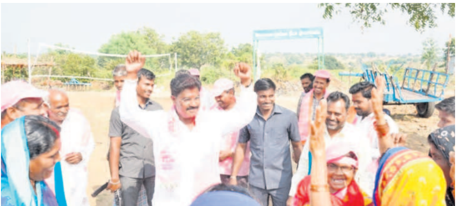
నృత్యం చేస్తున్న హస్తాంతరం