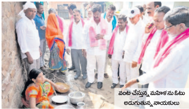
వంట చేస్తున్న మహిళను ఓట అడుగుతున్న నాయకులు