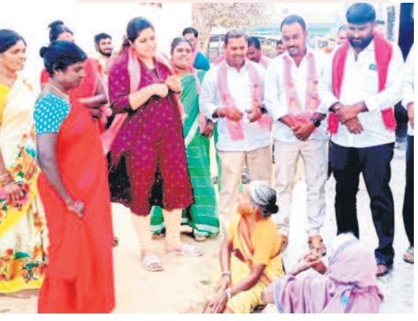
కథలాపూర్ మండలం పెద్దగల్లో తండ్రి చల్లెడ లక్ష్మీనర్సయ్యల హారావును గెలిపించాలని జిల్లా ఎన్టీఆర్ కార్యకర్తలతో కలిసి వృద్ధులను ఓటు అడుగుతున్న నిహారిక