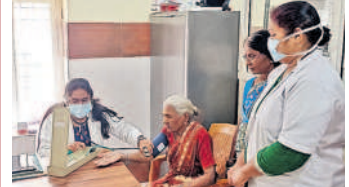
ఘట్కేసర్ లో వైద్యం అందిస్తున్న వైద్యురాలు