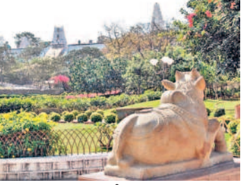
కీసరగుట్ట భవాని రామలింగేశ్వరస్వామి ఆలయం నారాయణస్వామి ప్రత్యేకం, 10న నానావిధ పుష్పార్చన, 11న శ్రీసుబ్రహ్మణ్యేశ్వరస్వామి వారి కల్యాణం, 12న స్వామివారికి తైలాభిషేకం వంటి కార్యక్రమంతో కార్తిక మాసం పూజలు ముగియనున్నాయి.

చారు. ఈనెల 14న గర్వాలయంలో స్వామివారికి మహా న్యాస పూర్వక రుద్రాభిషేకం, క్షీరాభిషేకం, ఆకాశ దిపోత్సవం, 17న నాగుల చవితి పుట్టలో పాలు పోయుట, నాగదేవత ఆలయంలో ప్రత్యేక పూజలు, 19న శ్రీసుబ్రహ్మణ్యేశ్వరస్వామి కల్యాణం, 20న పంచామృతాభిషేకం, 23న శ్రీ సత్యనారాయణస్వామి ప్రత్యేకం, 24న క్షీరాభిషేకం, తులసిపూజ, 26న నానావిధ ఫల రసాభిషేకం, జ్వాలాంతరణం, మహాలింగ దిపోత్సవం, 27న రుద్రాభిషేకం, కార్తికపౌర్ణమి కావడంతో ఇక్ష్వ రసాభిషేకం, 30న శ్రీభవాని రామలింగేశ్వరస్వామివారి కల్యాణం, డిసెంబర్ 3న నానావిధ పుత్రిపూజ, 4న క్షీరాభిషేకం, 8న శ్రీసత్య