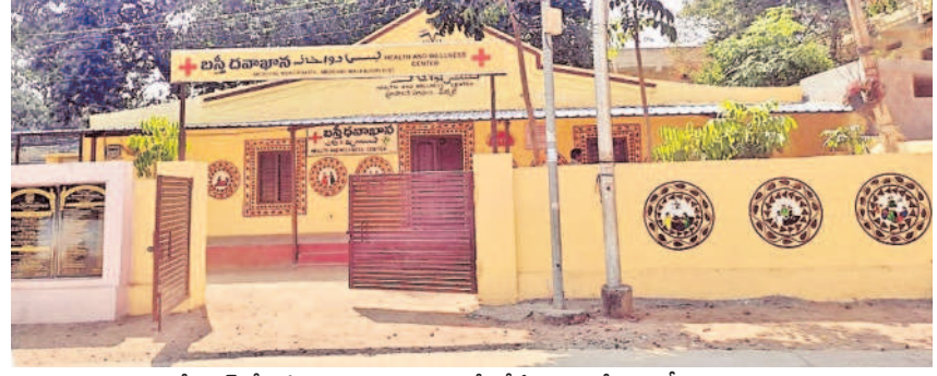
మేడ్చల్ లోని పాత గ్రామ పంచాయతీలో ఏర్పాటు చేసిన బస్టి దవాఖాన

ఓటీతో పాటు అవసరమైన వారికి 15 రకాల వైద్య పరీక్షలు చేస్తున్నారు. ఎఫ్.బీ.ఎస్, సీఆర్.పీ, హెచ్.బీ.ఎస్, డైరామెట్, సిరం క్యాల్షియం, ఎల్.ఎఫ్.టీ, డెంగీ తదితర పరీక్షలు నిర్వహిస్తున్నారు. సోమవారం నుంచి శుక్రవారం వరకు ఉదయం 9 నుంచి సాయంత్రం 4 గంటల వరకు, ఆదివారం ఉదయం 9 గంటల నుంచి మధ్యాహ్నం వరకు వైద్య సేవలు అందిస్తున్నారు. చికిత్సతోపాటు మందులను ఉచితంగా అందజేస్తున్నారు. ఒక్కో బస్టి దవాఖానలో ప్రతిరోజూ 60 నుంచి 120 మంది వరకు ఓటీ సేవలు అందుతున్నాయి. దవాఖానాలో ఒక వైద్యుడు, స్టాఫ్ నర్సు, ల్యాబ్ టెక్నిషియన్ వైద్య సేవలు అందిస్తున్నారు. అలాగే టెలి కన్సల్టేషన్ ద్వారా 10 రకాల స్పెషలిటీలను కలిపి అవకాశాన్ని కూడా కల్పించారు.