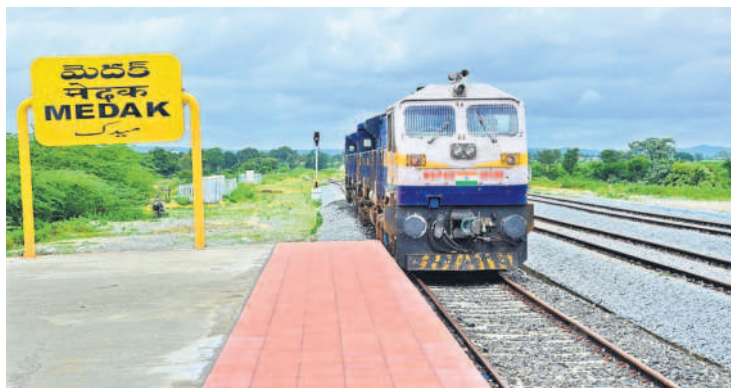
మెదక్ రైల్వే స్టేషన్