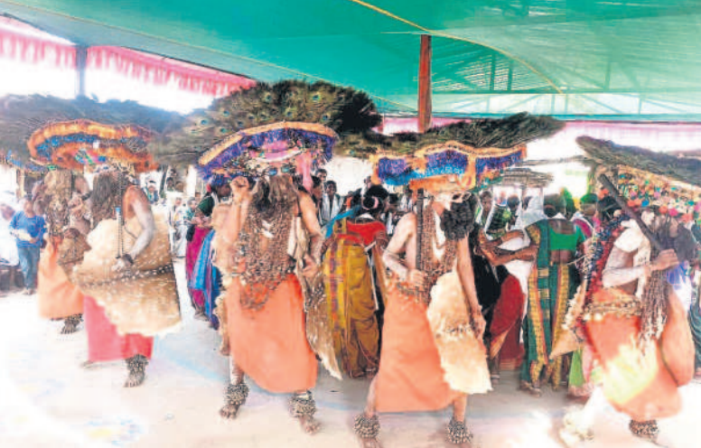
దండారి వేడుకల్లో పాటలు పాడుతూ నృత్యం చేస్తున్న మహిళలు