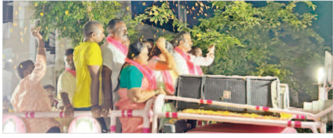
దేవరకర్త: పెద్ద గోపాపూర్ లో చేస్తున్న ఎమ్మెల్యే ఆల

మన్నారు. అదేవిధంగా గ్రామం నుంచి పెద్ద రాజమూర్ గ్రామం వరకు రూ.5.5కోట్ల నిధులతో బీటీ నిర్మాణం చేశామన్నారు. గ్రామంలో 'మన ఊరు-మన బడి' కింద పాఠశాల పునర్నిర్మాణానికి రూ.1.60కోట్లు మంజూరు కావడంతో పూర్తి చేశామని తెలిపారు. పెద్దగోపాపూర్, మీనుగోనిపల్లి గ్రామాలకు ప్రత్యేక గ్రామ పంచాయతీలు ఏర్పాటు చేశామన్నారు. చిన్న గ్రామాల్లో సీఎం కేసీఆర్ సహకారంతో ఎంతో అభివృద్ధి చేశామని చెప్పారు. దేశంలో అమలు కాని సంక్షేమ పథకాలు తెలంగాణలో అమలు అవుతున్నాయన్నారు. రైతులకు 24 గంటల పాటు విద్యుత్ అందుతున్న ఏకైక రాష్ట్రం తెలంగాణ అన్నారు. మరోసారి కేసీఆర్ అధికారం