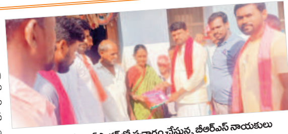
దేవరకర్త : కోయిల్ సాగర్ లో ప్రచారం చేస్తున్న బీఆర్ఎస్ నాయకులు