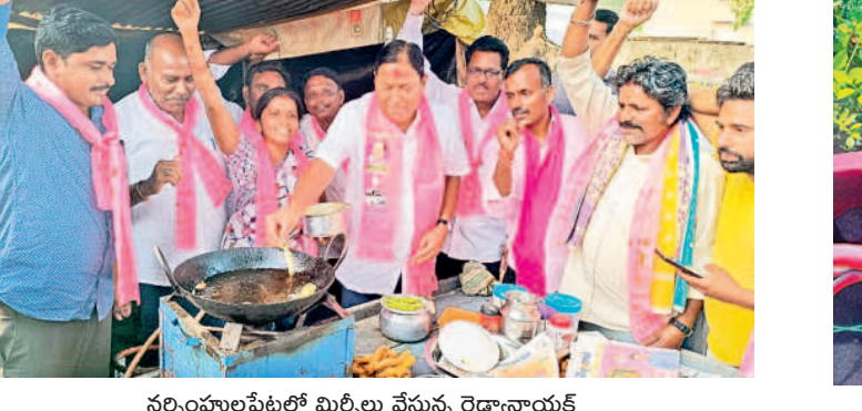
నర్సంపాలపేటలో మిర్చిలు వేస్తున్న రెడ్డానాయక్