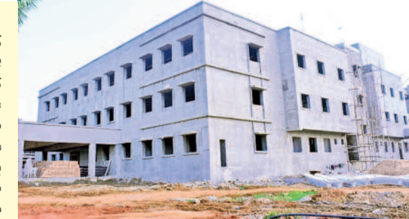
రూ.70 కోట్లతో నర్సంపేటలో నిర్మింపబడుతున్న జిల్లా దవాఖాన