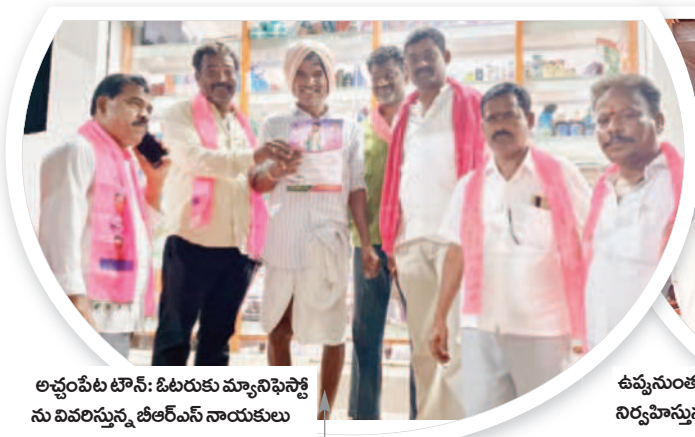
అచ్చంపేట టౌన్: ఓటరుకు మ్యూసిఫెన్స్ ను వివరిస్తున్న బీఆర్ఎస్ నాయకులు