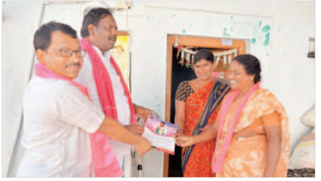
వంగూరు: తిప్పారెడ్డిపల్లిలో బీఆర్ఎస్ ఇంటింటి ప్రచారం