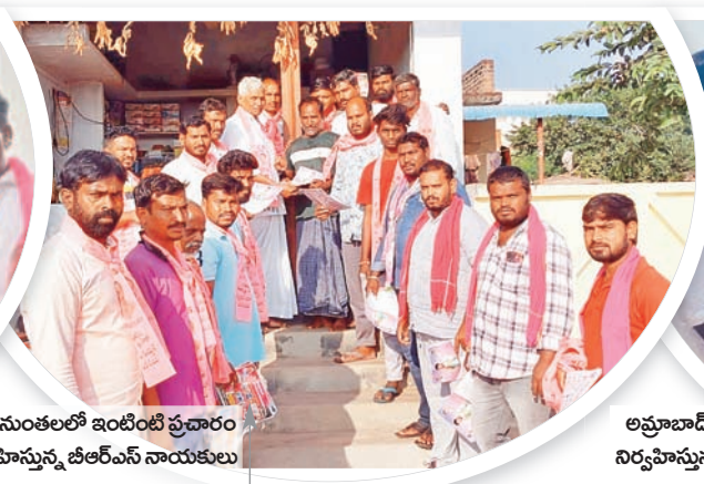
ఉప్పునుంతులలో ఇంటింటి ప్రచారం నిర్వహిస్తున్న బీఆర్ఎస్ నాయకులు