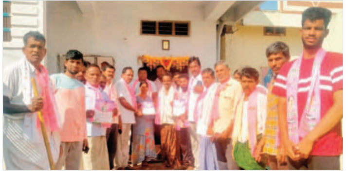
బల్లూరు: రామాజుపల్లిలో బీఆర్ఎస్ నాయకుల ప్రచారం