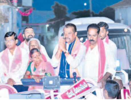
పల్లికొండలో ఎన్నికల ప్రచారంలో పాల్గొన్న వేముల

ఇచ్చిన కాంగ్రెస్ ఓట్లు వేయించుకొని, అప్పటికే ఉన్న ఏడు గంటల కంటే ఎక్కువ హామీ ఇచ్చిన రాష్ట్రంలో వ్యవసాయ విద్యుత్ కనెక్షన్ కావాలంటే రూ.1.80 లక్షలు కట్టాలన్నారు. తెలంగాణలో కేసీఆర్ ఉచితంగా కంటే ఇంకా ఉల్టా పైసలను పంట పెట్టుబడికి అందిస్తున్నారని గుర్తు చేశారు. కర్ణాటక, మహారాష్ట్రలో తెలంగాణలో అమలవుతున్న సంక్షేమ పథకాలు లేవన్నారు. కావాలంటే మానాలకు చెందిన కాంగ్రెస్ నాయకులు ఆ రెండు రాష్ట్రాలకు వెళ్లి పచ్చి మానాలలో అమర వీరుల స్తూపం వద్ద నిజం చెప్పాలని సూచించారు. తాను చెప్పింది నిజమే అయితే వారు కూడా కారు గుర్తుకు ఓటు వేయాలని కోరారు.