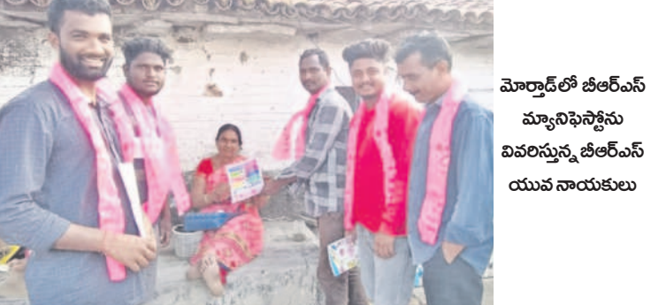
మోర్కాడ్లో బీఆర్ఎస్ మ్యూనిసిపాలిటీను వివరిస్తున్న బీఆర్ఎస్ యువ నాయకులు