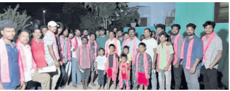
బాల్కొండ మండలం జలాల్ పూర్లో బీఆర్ఎస్ నాయకుల ప్రచారం