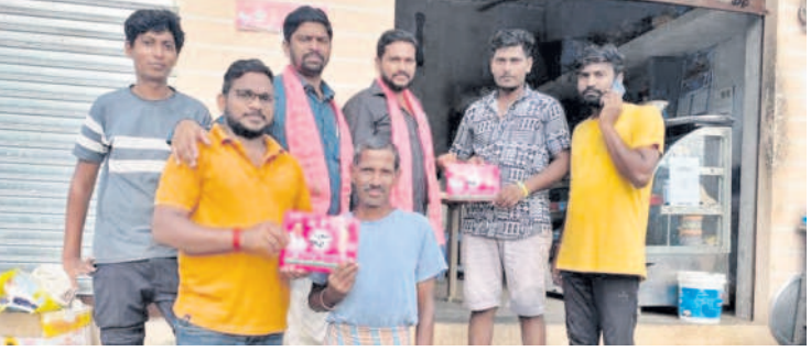
మెండోరా మండలం దూడీగాంలో..