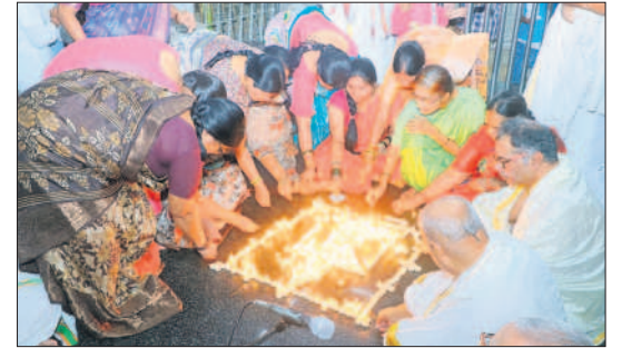
రాజన్న ఆలయంలో దీపాలు వెలిగిస్తున్న భక్తులు