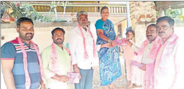
మర్రిపల్లిలో మహిళాను ఓట అభ్యర్థిస్తున్న బీఆర్ఎస్ నాయకులు