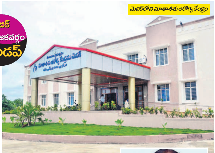
మెదక్లోని మాతాశిశు ఆరోగ్య కేంద్రం