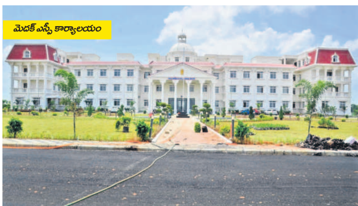
మెదక్ ఎస్సీ కార్యాలయం