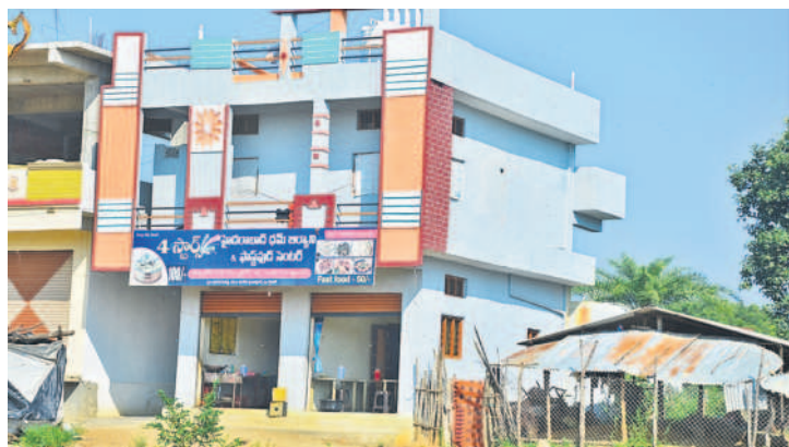
మెదక్ జిల్లా హవేళీ ఘనపూర్ మండలం బూరుగుపల్లిలో వెలసిన బిర్లాసీ పాఠశాల