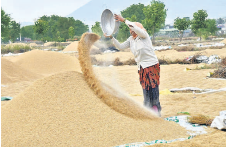
సిద్దిపేట జిల్లా కేంద్రంలో వరిధాన్యాం ఆరబోస్తున్న మహిళ