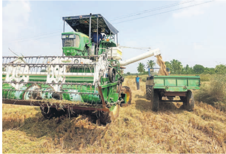
సిద్దిపేట జిల్లాలో వరికోతలు