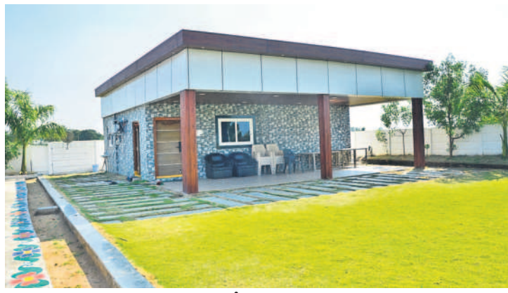
మెదక్ జిల్లాలో నిర్మించిన పాఠశాల

మంజీర ఒడ్డునే జీవాలు మేస్తున్న ర్యూజియల్ మనకు నిత్యం కనిపిస్తున్నాయి. ఇక్కడే కాకుండా ఇతర ప్రాంతాల్లోనూ ఇలాంటి ర్యూజియల్ మనస్తున్నాయి.