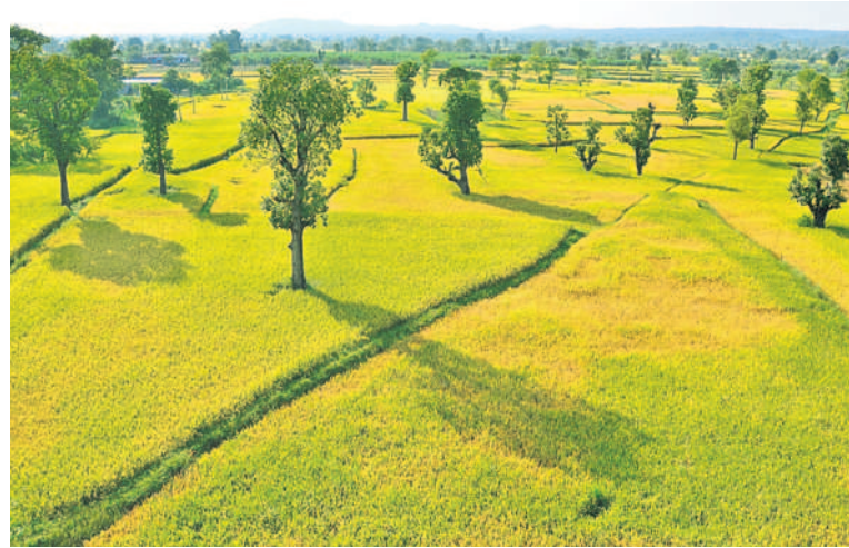
మెదక్ జిల్లాలో పచ్చని పంటపొలాలు