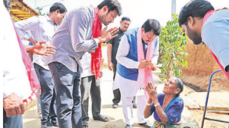
బీడ్డు మా ఓటు కారుగుర్తుకు వేస్తూ అంటున్న రాయపాల్ మండలంలోని వ్యవధూలు

బీఆర్ఎస్ కు వేస్తారా ప్రజలు ఆలోచించి నిర్ణయం తీసుకోవాలన్నారు. గత ఉప ఎన్నికల్లో ప్రజలు మోసం చేసి వ్యాధులను విస్తరించిన ఎమ్మెల్యే రఘునందన్ రావుకు మళ్ళీ ఓటు వేస్తే భవిష్యత్ అంధకారమేనన్నారు. బీజేపీని ఆదర్శంగా తీసుకోవాలని మాజీ ఎమ్మెల్యే ఛరూభూహుస్సినే అన్నారు. బీజేపీ, కాంగ్రెస్ పాలిత రాష్ట్రాల్లో రైతులకు 24 గంటల విద్యుత్ ఎందుకు ఇవ్వడం లేదని ప్రశ్నించారు. దుబ్బాక జిల్లాలో బీఆర్ఎస్ అభివృద్ధి