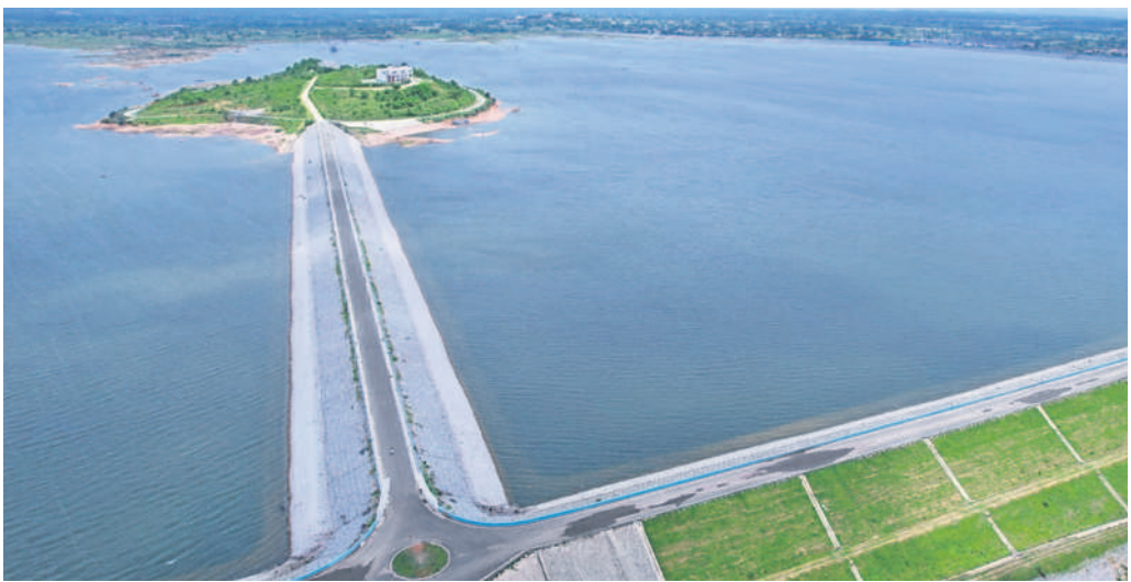
సిద్దిపేట జిల్లా చిన్నకోడూరు మండలంలోని రంగనాయకసాగర్

సిద్దిపేట, నవంబర్ 11 (నమస్తే తెలంగాణ ప్రతినిధి) : సీఎం కేసీఆర్ భగీరథ ప్రయత్నం చేసి ఎక్కడో ఉన్న గోదారమ్మను ఉమ్మడి మెదక్ జిల్లాకు తెచ్చి నిర్మల వారిన, బీడు భూముల్లో గోదావరి జలాలను పారించడంతో బంగారు పంటలు పండుకున్నాయి. పొడిపంటలతో సస్యశ్యామలంగా మారి పల్లె కల్లి సరంబురపడుతున్నది. ఎక్కడెక్కడో వలస పోయిన వారంతా మూడు నాలుగేండ్ల నుంచి తిరిగి సొంత ఊళ్లకు వచ్చి పనులు చేసుకుంటున్నారు. చేసుకున్న వాళ్లకు చేసుకున్నంత పని దొరుకుతున్నది. ఉమ్మడి మెదక్ జిల్లాలో పల్లెలు పచ్చని వాతావరణంలో ఉట్టిపడుతున్నాయి. సాగునీరు అందబాటలోకి రావడం, ఉచిత కరెంట్ సరఫరా, రైతుబంధుత్వపాటు ప్రభుత్వ చేయూతతో గుంటజాగ లేకుండా పంటలు సాగుతున్నాయి. దీంతో