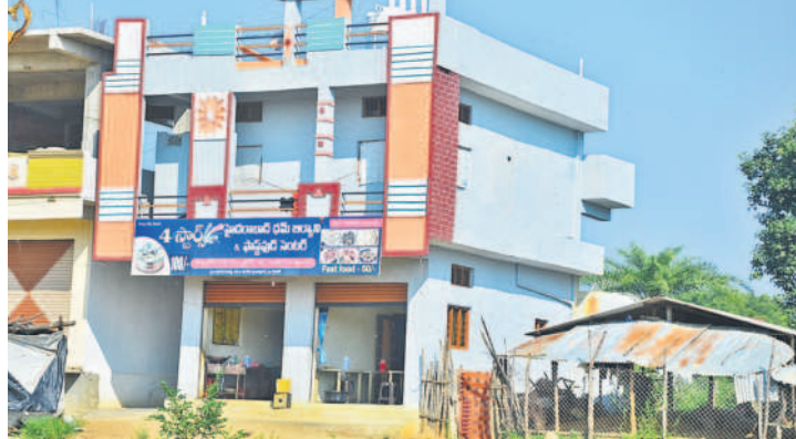
మెదక్ జిల్లా హవేళీ ఘనపూర్ మండలం బూరుగుపల్లిలో వెలసిన బిర్లావీ పాఠశాల