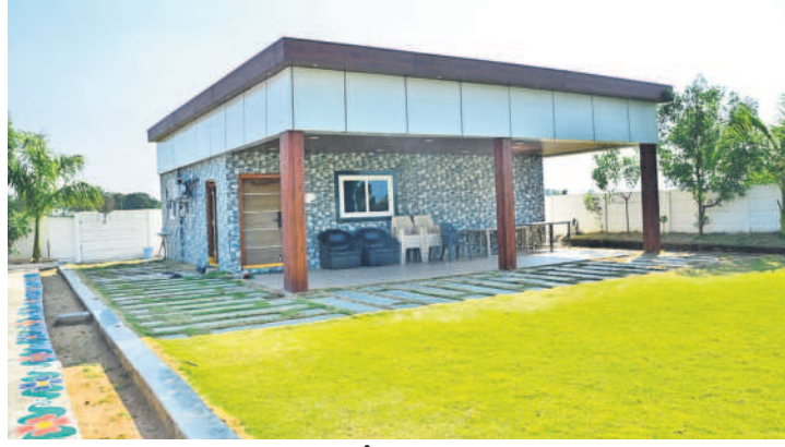
మెదక్ జిల్లాలో నిర్మించిన పాఠశాల