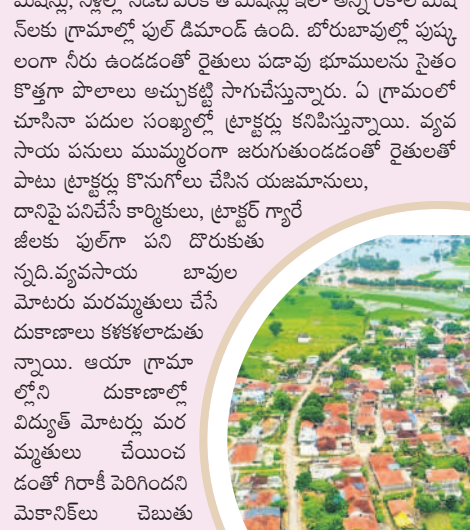
నేడు బతుకు మారింది