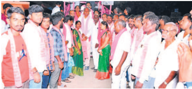
పల్లా సమక్షంలో బీఆర్ఎస్ చేరిన సీపీఎం, కాంగ్రెస్, బీజేపీ నాయకులు