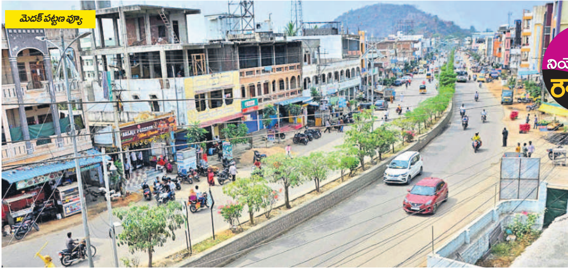
మెదక్ పట్టణ వ్యూ