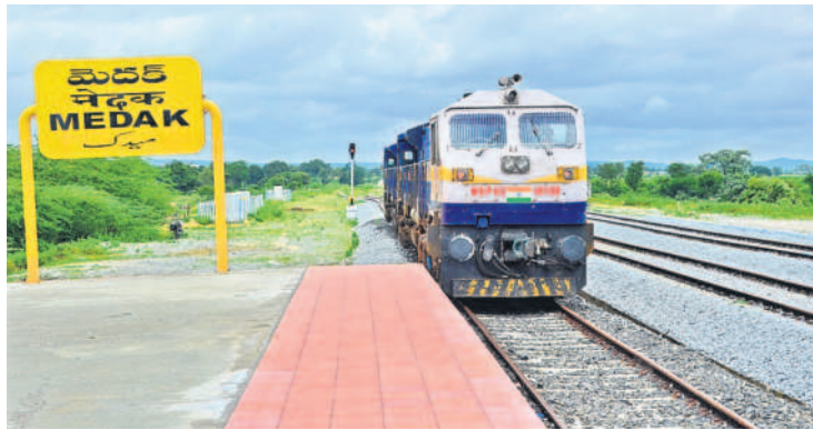
మెదక్ రైల్వే స్టేషన్