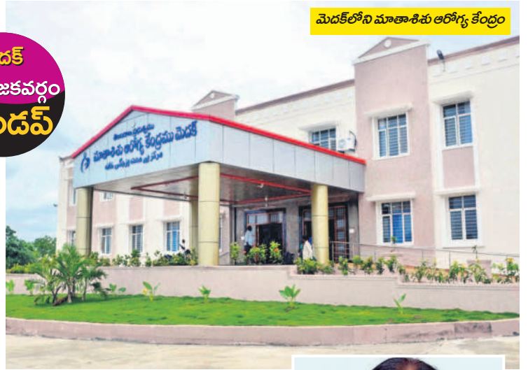
మెదక్ లోని మాతాశిశు ఆరోగ్య కేంద్రం