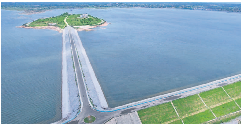
సిద్దిపేట జిల్లా బిన్నకోడూరు మండలంలోని రంగనాయకసాగర్