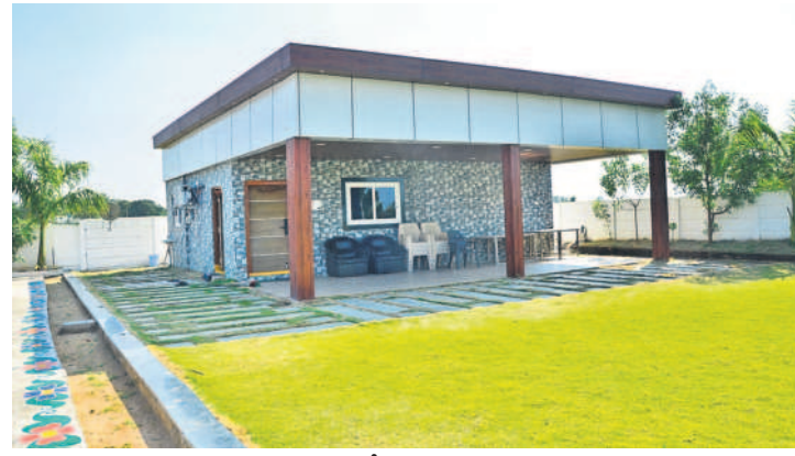
మెదక్ జిల్లాలో నిర్మించిన పాంచాక్ష

మంజీర ఒడ్డునే జీవాలు మేస్తున్న ర్యూజియల్ మనకు నిత్యం కనిపిస్తున్నాయి. ఇక్కడే కాకుండా ఇతర ప్రాంతాల్లోనూ ఇలాంటి ర్యూజియల్ మనస్తున్నాయి.