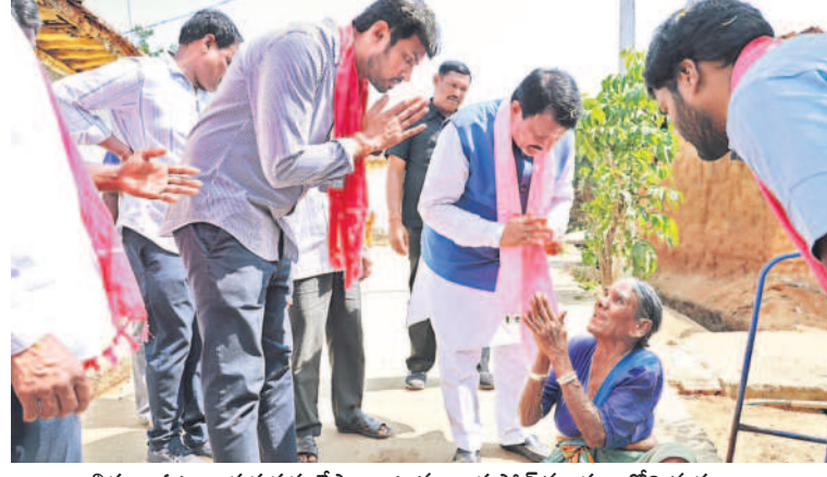
బిడ్డ మా ఓటు కారుగుర్తుకు వేస్తూ అంటున్న రాయపాల్ మండలంలోని వృద్ధురాలు

సీఎం కేసీఆర్ ఎనిమిదేండ్లలోనే సాగునీటితో పాటు ఇతర రంగాల్లో తెలంగాణ రాష్ట్రం గణనీయంగా అభివృద్ధి సాధించింది. పల్లెల్లో పచ్చని వాతావరణం సాధ్యమైంది. అన్ని వర్గాల వారికి చేతినిండా పని దొరుకుతున్నది. ఇవాళ ఇతర రాష్ట్రాలకు అభివృద్ధి, ఆశ్రయమిస్తున్నది. ఇతర రాష్ట్రాల నుంచి ఇక్కడికి కూలీలు పెద్ద ఎత్తున వచ్చి పనులు చేసుకుంటున్నారు. నాట్ల నుంచి వరి కోతల వరకు అన్ని పనుల్లో ఉపాధి పొందుతున్నారు. రైస్ మిల్లులు, ఇతర పరిశ్రమల్లో కూడా ఇతర రాష్ట్రాల నుంచి వచ్చిన కూలీలు ఉన్నారు. వరికోతలు ప్రారంభం కావడంతో ఇక్కడ కొత్తగా పొలాలు అప్పుకట్టి సాగుచేస్తున్నారు. ఏ గ్రామంలో చూసినా పదుల సంఖ్యలో ట్రాక్టర్లు కనిపిస్తున్నాయి. వ్యవసాయ పనులు ముమ్మరంగా జరుగుతుండడంతో రైతులతో పాటు ట్రాక్టర్ల కోసుగిలు చేసిన యజమానులు, దానిపై పనిచేసే కార్మికులు, ట్రాక్టర్ గ్యాజేటిలకు పుగ్గా పని దొరుకుతున్నది. వ్యవసాయ బావుల మేతలకు పాత మెదక్ జిల్లాకు దూకాణాలు కళకలాడుతున్నాయి. ఆయా గ్రామాల్లోని దుకాణాల్లో విద్యుత్ మోటార్ల మరమ్మత్తులు చేయించడంతో గిరాకీ పెరిగింది మెతుకు సీమలకు పాత మెదక్ జిల్లాకు తీసుకువస్తున్నారు.