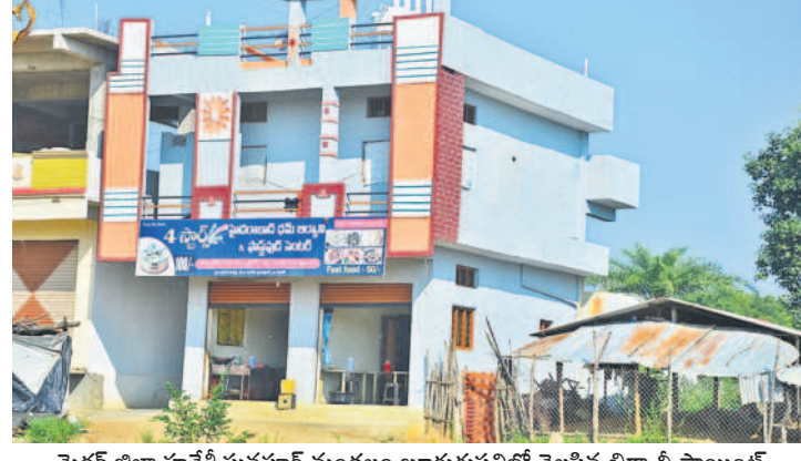
మెదక్ జిల్లా హవేళీ ఘనపూర్ మండలం బూరుగుపల్లిలో వెలసిన బిర్లాసీ పాయింట్