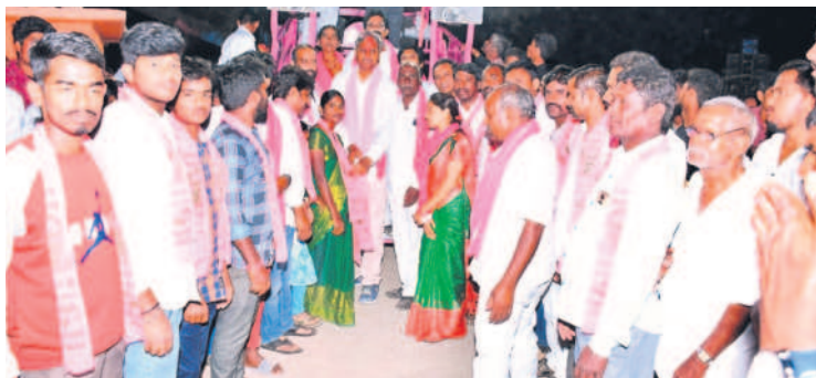
పల్లా సమక్షంలో బీఆర్ఎస్ చేరిన సీపీఎం, కాంగ్రెస్, బీజేపీ నాయకులు