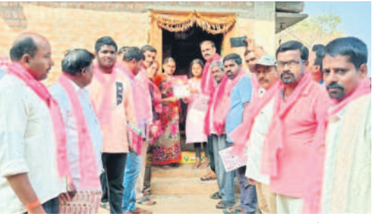
దౌల్తాబాద్ : ముబారాన్ పూర్లో ఇంటింటి ప్రచారం చేస్తున్న బీఆర్ఎస్ నాయకులు, కార్యకర్తలు