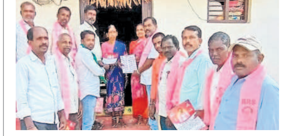
మిరుదొడ్డిలో ఇంటింటి ప్రచారం చేస్తున్న బీఆర్ఎస్ నాయకులు