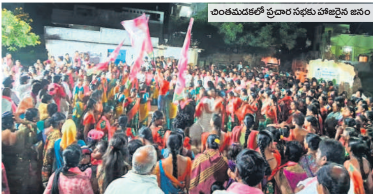
చింతమడకలో ప్రచార సభకు హాజరైన జనం