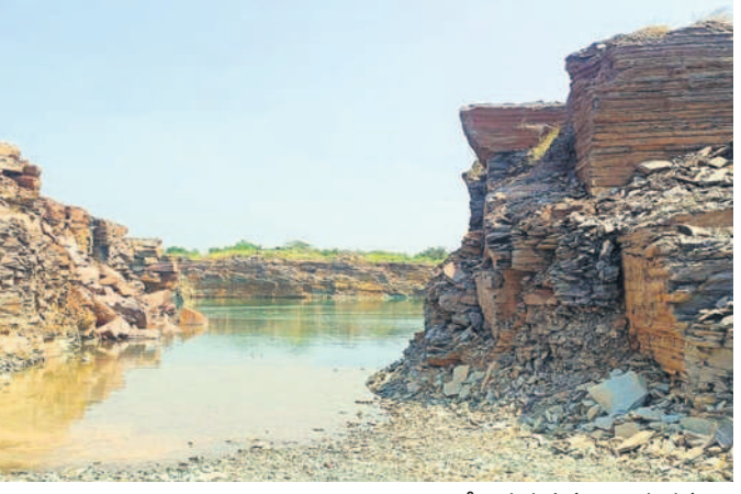
చిట్టాలలో జరుగుతున్న ప్రాజెక్టు పనులు

అక్షయ వాగుపై ప్రాజెక్టు నిర్మాణం నిరంతరం ప్రవహించే అక్షయ వాగు అడవిదేవులపల్లి మండలంలోని చిట్టాల వద్ద కృష్ణానదిలో కలుస్తున్నది. ఈ నీరు ప్రస్తుతం టెంపింగ్ పద్ధతిలోనే వైఖాగాన ఉన్నది. ఏటా వందలాది టీఎన్ఎస్ విరు వ్యధాగా దిగుతున్న పోతులపల్లి. ఈ నీటిని సద్వినియోగం చేసుకొని పొలాలకు అందించాలని రాష్ట్ర ప్రభుత్వం యోచించింది. ఈ క్రమంలో చిట్టాల గ్రామ శివారులోని అక్షయ బ్యాక్ వాటర్ వద్ద దున్నపోతుల గండి ప్రాంతంలో ప్రాజెక్టు ఏర్పాటును నిరంతరం అదుబాటులో ఉంటుండడంతో రిజర్వాయర్ ఏర్పాటు చేసి 16 కోటి రూపాయల వైఫల్యాల ద్వారా ముదిమాణిక్యం మేజర్ ఉద్యమాలపై వద్ద ఆర్ - 24కు అనుసంధానం చేయనున్నారు. అక్కడక్కడ లిఫ్టులు ఏర్పాటు చేసి ఆయుగా గ్రామాలకు సాగునీరు అందించనున్నారు. ఇందుకోసం ప్రభుత్వం రూ.219కోట్లు మంజూరు చేసింది. ఈ ప్రాజెక్టు పూర్తయితే అడవిదేవులపల్లి మండలంలోని ఉద్యమాలపై, ముదిమాణిక్యం, అడవిదేవులపల్లి, బాలెపల్లి, మొలపల్లి, చిట్టాల, చాంపాతం గ్రామాల పరిధిలో 12,610 ఎకరాలకు సాగునీరు అందునుంది. ఎక్కువగా రోడ్డు, వర్షంపైనే ఆధారపడి వ్యవసాయం చేసే అడవిదేవులపల్లి మండల రైతులు ఈ ప్రాజెక్టుతో దణ్ణా సాగు చేసుకోవచ్చని ఆనందం వ్యక్తం చేస్తున్నారు. అన్ని సీజన్లలో పుష్కలంగా సాగు నీరు అందుతుందని ఆశాభావం వ్యక్తం చేస్తున్నారు.