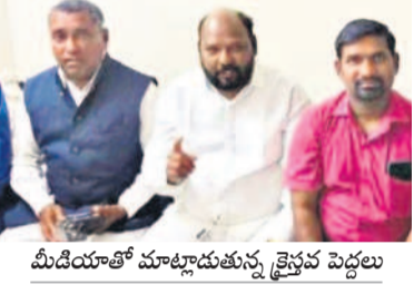
మీడియాతో మాట్లాడుతున్న క్రైస్తవ పెద్దలు

హైదరాబాద్, నవంబర్ 13 (నమస్తే తెలంగాణ): క్రైస్తవ సోదరుల సమావేశమని పిలిచి వచ్చారు, తీరా ఇక్కడికి వచ్చిన తర్వాత దేవాలయంలో కాంగ్రెస్ పార్టీకి మద్దతుగా డిక్లరేషన్ అని ప్రకటించారని పలువురు క్రైస్తవులు బిషప్లకు, పాస్టర్లకు అభ్యంతరం వ్యక్తం చేశారు. యునైటెడ్ క్రైస్తవ అభ్యంతరం సమీపంలోని భారత్ క్రైస్టియన్ కౌన్సిల్ కార్యాలయంలో సోమవారం వారు విలేజ్ కలనుతో మాట్లాడారు. క్రైస్టియన్ కౌన్సిల్ సమావేశం ఉన్నదని పిలిచి వచ్చామని, బీఆర్ఎస్, కాంగ్రెస్ తోపాటు అన్ని పార్టీల నాయకులు వస్తూ, మన సమస్యలపై చర్చించాలని చెప్పారని తెలిపారు. కానీ ఇక్కడికి వచ్చిన తర్వాత కాంగ్రెస్ డిక్లరేషన్ అని చెప్పుకోవడం సరికాదని మండిపడ్డారు. క్రైస్తవుల సమస్యలను కాంగ్రెస్ ఎన్నడైనా పట్టించుకున్నదా? అని నిలదీశారు. అసత్య సమాచారంతో, మనసులో తప్పుడు ఉద్దేశంతో క్రైస్తవ