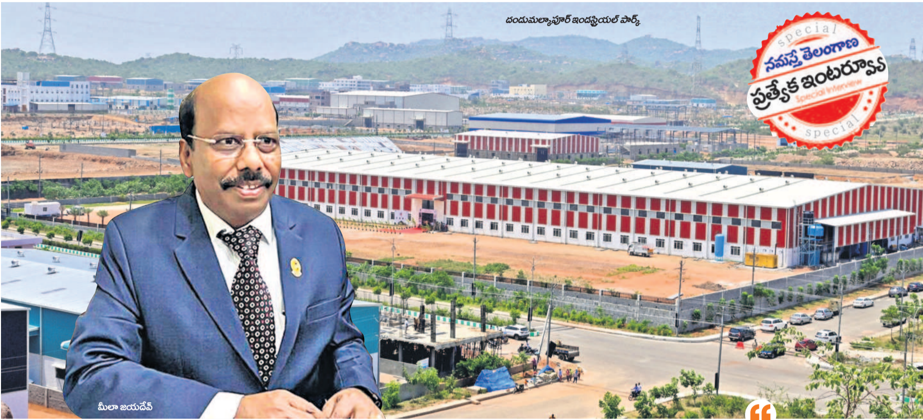
దందుమల్యాపూర్ ఇండస్ట్రయల్ పార్క్