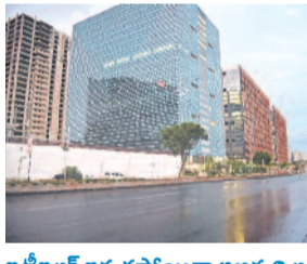
బట్టి ఎగుమతులను రెట్టింపడానికి అభివృద్ధి అభివృద్ధి.

ఈ మాట ఇప్పుడు అక్షర సత్యం అయ్యింది. రెట్టింపు కాదు ఏకంగా నాలుగు రెట్లు బట్టి ఎగుమతులు పెరిగాయి. పదేండ్లలో ప్రపంచమే ఆశ్చర్యపోయేలా ఈ రంగంలో తెలంగాణ అద్భుత ప్రగతిని సాధించింది. రాష్ట్రంలో ఈ రంగం అభివృద్ధికి కేసీఆర్ ప్రభుత్వం తీసుకున్న చర్యలు విజయవంతం అయ్యాయి. కొత్త బట్టి పాలసీని రూపొందించి పెట్టుబడులను ఆకర్షించడంలో సర్కార్ సక్సెస్ అయ్యింది. కొత్త కంపెనీలను హైదరాబాద్ తీసుకువచ్చేందుకు మంత్రి కేటీఆర్ చేసిన ప్రయత్నాలు ఫలితమే.. గత పదేండ్లలో రాష్ట్రం నుంచి బట్టి ఎగుమతులు రెట్టింపయ్యాయి. రాష్ట్రంలో ఈ రంగంలోని ఉద్యోగాలు మూడు రెట్లు పెరిగాయి.