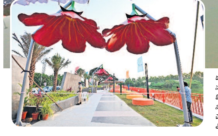
కూకట్పల్లి పరిధిలోని రంగధాముని (బడిఎల్) చెరువును ప్రభుత్వం అత్యాధునిక హంగులతో సుందరికరిస్తున్నది. ఇందుకోసం రూ.50 కోట్లతో ప్రణాళికలు సిద్ధం చేసింది. ఇప్పటికే రూ.8 కోట్లతో ప్రంట్ లెక్ పూర్తి అభివృద్ధి చేసింది. చెరువు మట్టా కంచెతో పాటు వాకింగ్ ట్రాకిని నిర్మించగా, వినాయక, బతుకమ్మ, దుర్గామాత నిమజ్జనాల కోసం ప్రత్యేక పర్కాట్లు చేశారు. చెరువులోకి మురుగునీరు చేరకుండా రూ.19.3 కోట్లతో ప్రత్యేక డైవర్లైన్లు వేస్తున్నారు. భవిష్యత్ లో బోటింగ్ సౌకర్యం కూడా కల్పించాలని అధికారులు భావిస్తున్నారు. - కేపీహెచ్ఐ కాలనీ