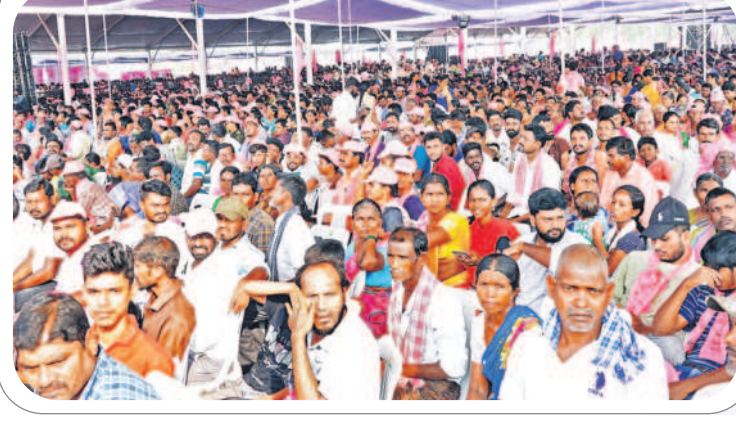
బూర్గంపాడులో నిర్వహించిన ప్రజా ఆశీర్వాద సభకు హాజరైన పినపాక, భద్రాచలం నియోజకవర్గాల ప్రజలు

కాంగ్రెస్ హయాంలో ఆకలి చావులు, ఆత్మహత్యలు