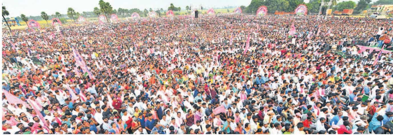
సర్పంచి సభకు హాజరైన జనం

ఇన్వ్యాక ప్రభుత్వం విడుదలచేసిన ప్రతి రూపాయి రైతుల అకౌంట్లలో పడుతుందంటే.. ధరణి పుణ్యమే