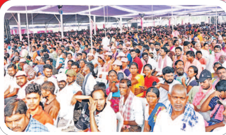
బూర్గంపాడులో నిర్వహించిన ప్రజా ఆశీర్వాద సభకు హాజరైన పినపాక, భద్రాచలం నియోజకవర్గాల ప్రజలు

కాంగ్రెస్ హయాంలో ఆకలి చావులు, ఆత్మహత్యలు