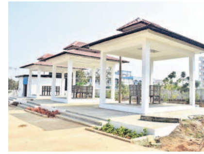
పీర్షాద్ గూడ వైకుంఠధామంలో ఏర్పాటు చేసిన బర్నింగ్ ఫ్లాట్ ఫామిల