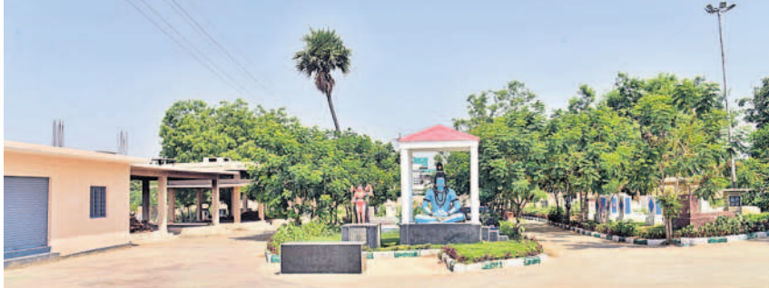
నాగారంలో ఏర్పాటు చేసిన వైకుంఠధామం