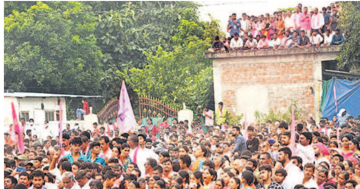
బిల్డింగ్ పై నుంచి సీఎం కేసీఆర్ ప్రసంగాన్ని ఆసక్తిగా వీక్షిస్తున్న ప్రజలు

నర్సంపేట/నర్సంపేట రూరల్, నవంబర్ 13: నర్సంపేట గులాబీ తోపేట తలపించింది. సోమ వారం పట్టణంలోని సర్కారులలో నిర్వహించిన నియోజకవర్గ ప్రజా ఆశీర్వాద బహిరంగ సభ గ్రాండ్ సక్సెస్ అయ్యింది. నియోజకవర్గంలోని నర్సంపేట, నల్లదెల్లి, వెన్నారాపేట, ఖానాపురం, దుగ్గొండ, నెక్కొండ మండలాల నుండి వేలాదిగా ప్రజలు, బీఆర్ఎస్ నాయకులు, కార్యకర్తలు బహిరంగ సభకు తరలివచ్చి బీఆర్ఎస్ మద్దతు పలికారు. సభా ప్రాంగణం నిండిపోవడంతో అక్కడి నుంచి 5, 8కిలో మీటర్ల దూరంలో వేలాది మంది రోడ్డుపైనే ఉండిపోయారు. ప్రజలకు ఎక్కడా లోటు రాకుండా ఎమ్మెల్యే పెద్ది ఆధ్వర్యంలో ఏర్పాటు చేశారు. మహిళలు, నాయకులు, కార్యకర్తలకు వేర్వేరుగా బారికేడ్స్ ఏర్పాటు చేశారు. అభిమానులు బీఆర్ఎస్ జెండాలతో 'జై తెలంగాణ.. జై కేసీ ఆర్.. జై బీఆర్ఎస్' అంటూ నిదనస్తూ ర్యాలీగా సభకు చేరుకున్నారు. పలంబేర్లు వాటర్ బూటిళ్లు, ప్యాకెట్లు అందించారు. దివ్యాంగులు సైతం తరలివచ్చి మద్దతు తెలిపారు.