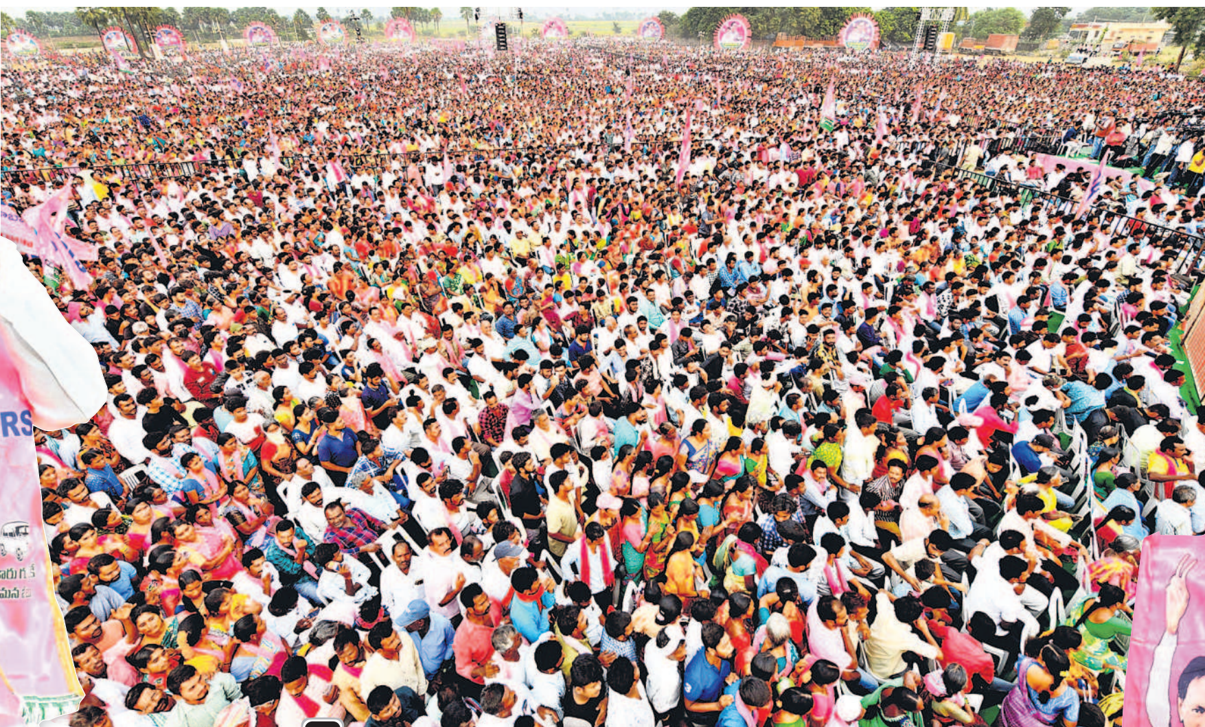
నర్సంపేట ప్రజా ఆశీర్వాద సభకు భారీగా తరలివచ్చిన జనం, అభివాదం చేస్తున్న సీఎం కేసీఆర్