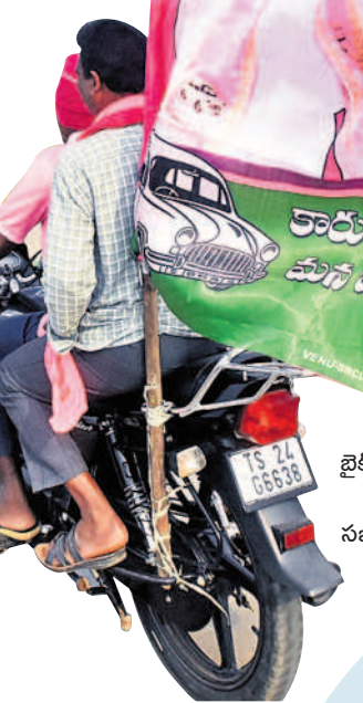
జైకాదు గులాబీ జెండాతో సభకు వస్తూ..