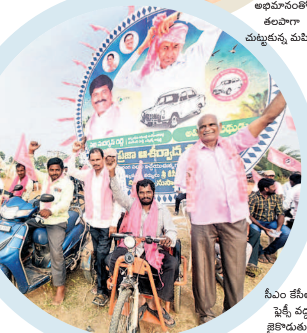
సీఎం కేసీఆర్ షెక్సీ వద్ద జైకాదుతున్న దివ్యాంగులు

ఆకట్టుకున్న రౌండ్ షెక్సీలు.. సభలో ఏర్పాటు చేసిన రౌండ్ షెక్సీలు ప్రత్యేక ఆకర్షణగా నిలిచాయి. ప్రాంగణంలో 20కి మైగ రౌండ్ షెక్సీలు ఏర్పాటు చేశారు. షెక్సీలో ఫూచర్ ఆఫ్ ఇండియా అని పేర్కొంటూ సీఎం కేసీఆర్, ఎమ్మెల్యే పెద్ది ఫోటోలు, కారు గర్జ ముద్రించగా ప్రజలు ఆసక్తిగా తిలకించారు