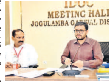
రాజకీయ నాయకులతో మాట్లాడుతున్న ఆర్డీ