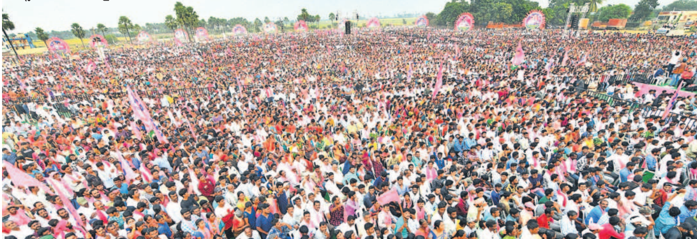
నర్సంపేట సభకు హాజరైన జనం

ఇవాళ ప్రభుత్వం విడుదలచేసే ప్రతి రూపాయి రైతుల అకౌంట్లలో పడుతుందంటే.. ధరణి పుణ్యమే