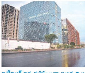
బట్టి ఎగుమతులను రెట్టింపడానికి అభివృద్ధి అభివృద్ధి అభివృద్ధి..