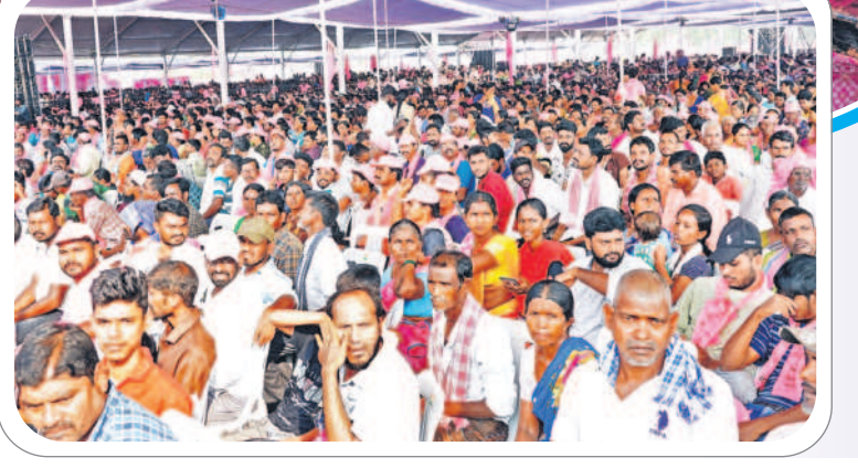
బూర్గంపాడులో నిర్వహించిన ప్రజా ఆశీర్వాద సభకు హాజరైన పినపాక, భద్రాచలం నియోజకవర్గాల ప్రజలు

కాంగ్రెస్ హయాంలో ఆకలి చావులు, ఆత్మహత్యలు