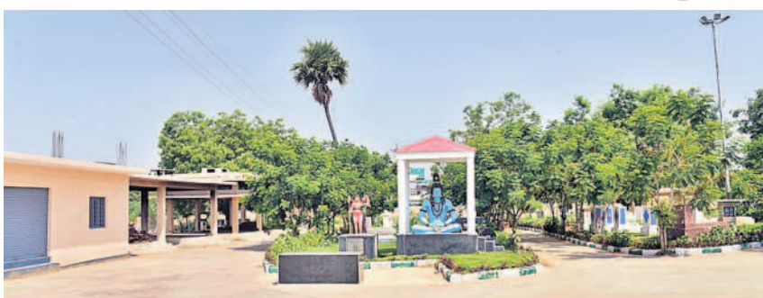
నాగారంలో ఏర్పాటు చేసిన వైకుంఠధామం