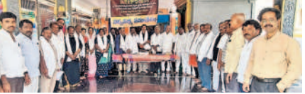
నాగారంలో రమా సత్యనారాయణ స్వామి, శ్రీ షిర్డీ సాయిబాబా, హోవమ్మ ఆలయాల నూతన కమిటీ సభ్యులు