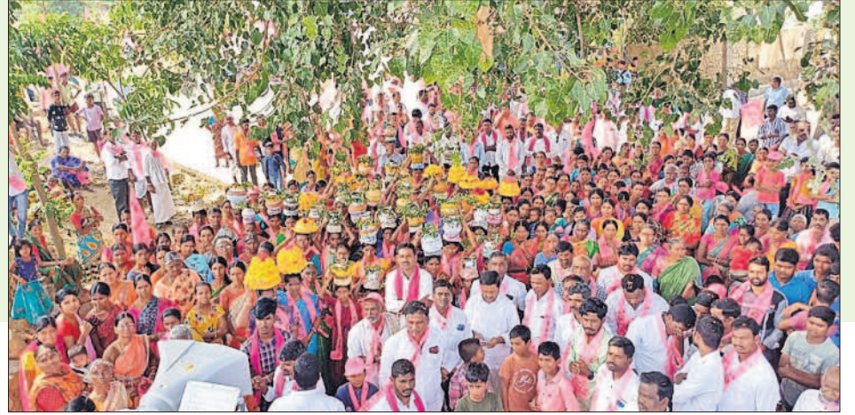
బోనాల ఊరేగింపులో మహిళలు, నేతలు, కార్యకర్తలు