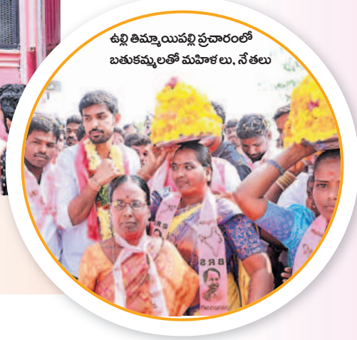
ఉల్లి తిమ్మయిపల్లి ప్రచారంలో బతుకమ్మలతో మహిళలు, నేతలు