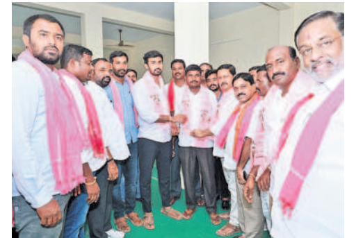
కొత్త వృద్ధిరెడ్డి సమక్షంలో బీఆర్ఎస్ లో చేరుతున్న కసాన్ పల్లిలో మాజీ ఉప సర్పంచ్ నాగులు