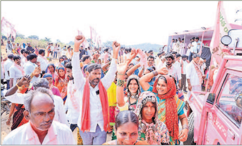
గొల్లపల్లి గిరిజన తండాలో బీఆర్ఎస్ ప్రచారంలో ఉత్సాహంగా పాల్గొన్న గిరిజన మహిళలు