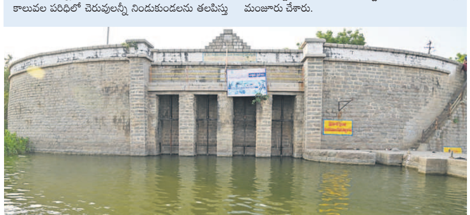
పాపన్నపేట మండల పరిధిలోని ఘనపూర్ ప్రాజెక్టు

115 ఏండ్ల క్రితం నిర్మించిన ఘనపూర్ (వనదుర్గా) ప్రాజెక్టు నేటికీ చెక్కు చెదరకుండా ఉంది. నవాబుల కాలంలో నిర్మించిన ఈ ప్రాజెక్టు సీమాంధ్ర పాలకుల హయాంలో నిర్వహణలోకి గురైంది. స్వరాష్ట్రంలో పూర్వజైతవాన్ని సంతరించుకుంది. ఈ ప్రాజెక్టుకు సీఎం కేసీఆర్ వనదుర్గా నామక రణం చేశారు. ప్రాజెక్టు అభివృద్ధికి రాష్ట్ర ప్రభుత్వం రూ.100 కోట్లు మంజూరు చేసింది. ప్రాజెక్టు ఎత్తు పెంపునకు రూ.43.64 కోట్లు కాగా, కొల్లారం, పాపన్నపేట మండలాల్లో 190 ఎకరాల భూ సేకరణకు రూ.13.10 కోట్లు ఇచ్చింది. ప్రాజెక్టు నుంచి ఆయకట్టుకు నీటిని విడుదల చేసే మహబూబ్ నగర్, ఫతేనగర్ కెనాల్ ను అభివృద్ధి చేసింది. మెదక్, పాపన్నపేట, హవేళీమసపూర్ మండలాల్లో ఆయా కాలనుపరిచి చెరువులన్నీ నిండుకుండలను తలపిస్తు