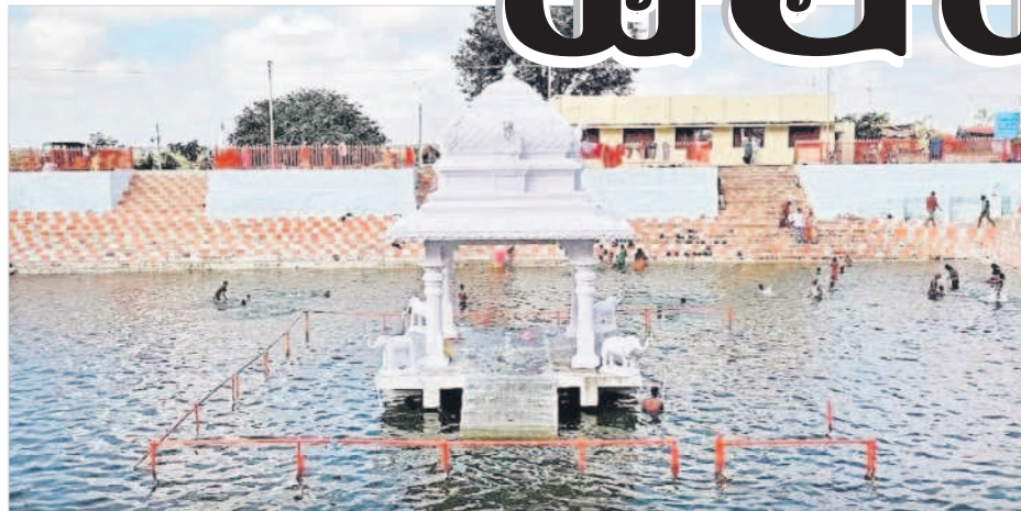
కురుమూర్తి ఆలయ ఆవరణలో కోనేరు