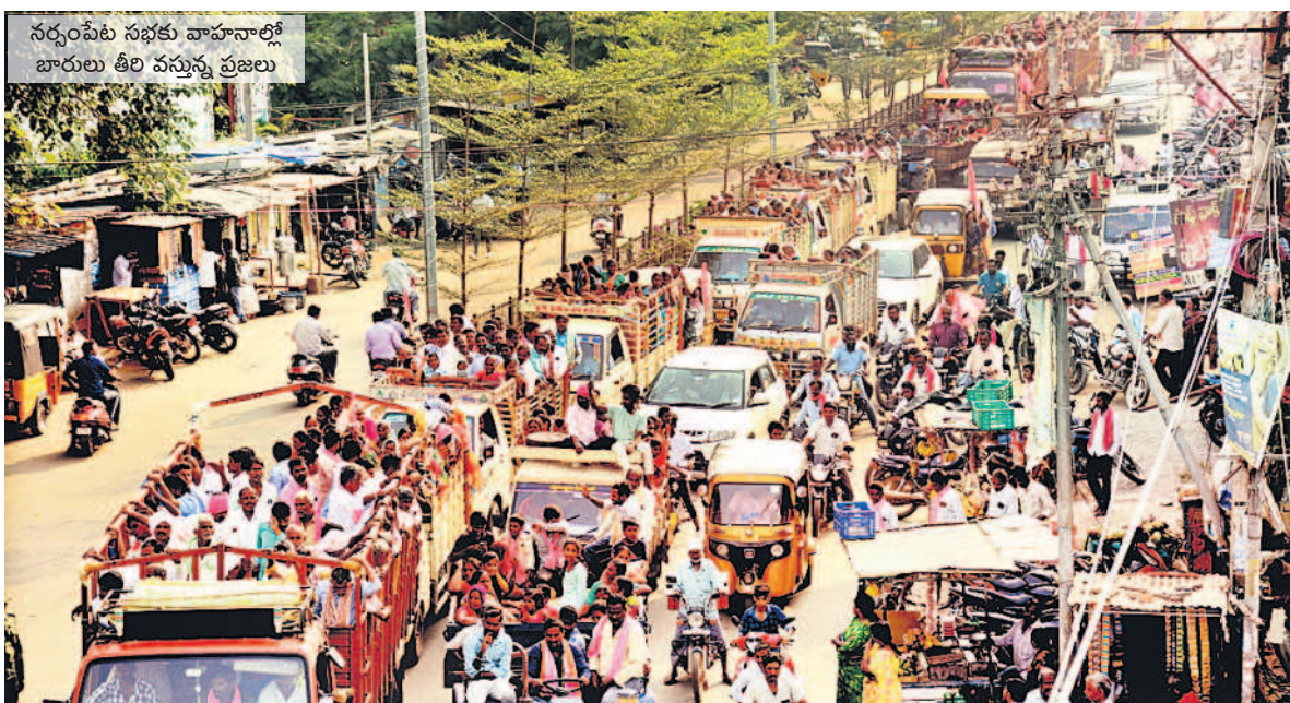
నర్సంపేట సభకు వాహనాల్లో భారులు తీరి వస్తున్న ప్రజలు