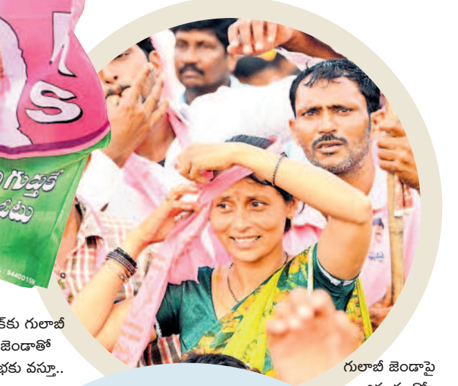
గులాబీ జెండాపై అభిమానంతో తలవగా మట్టుకున్న మహిళ

ఆకట్టుకున్న రౌండ్ షెక్సీలు.. సభలో ఏర్పాటు చేసిన రౌండ్ షెక్సీలు ప్రత్యేక ఆకర్షణగా నిలిచాయి. ప్రాంగణంలో 20కి పైగా రౌండ్ షెక్సీలు ఏర్పాటు చేశారు. షెక్సీలో ఫూచర్ ఆఫ్ ఇండియా అని పేర్కొంటూ సీఎం కేసీఆర్, ఎమ్మెల్యే పెద్ది ఫోటోలు, కారు గర్జ ముద్రించగా ప్రజలు ఆసక్తిగా తిలకించారు