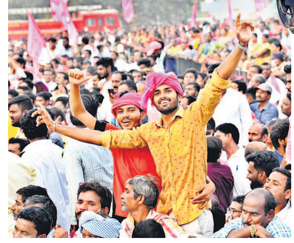
నర్సంపేట ప్రజా ఆశీర్వాద సభలో ఉత్సాహంతో నృత్యం చేస్తున్న యువకులు