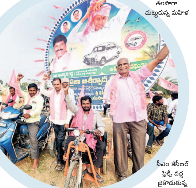
సీఎం కేసీఆర్ షెక్సీ వద్ద జైకాదుతున్న దివ్యాంగులు

ఆకట్టుకున్న రౌండ్ షెక్సీలు.. సభలో ఏర్పాటు చేసిన రౌండ్ షెక్సీలు ప్రత్యేక ఆకర్షణగా నిలిచాయి. ప్రాంగణంలో 20కి పైగా రౌండ్ షెక్సీలు ఏర్పాటు చేశారు. షెక్సీలో ఫూచర్ ఆఫ్ ఇండియా అని పేర్కొంటూ సీఎం కేసీఆర్, ఎమ్మెల్యే పెద్ది ఫోటోలు, కారు గర్జ ముద్రించగా ప్రజలు ఆసక్తిగా తిలకించారు