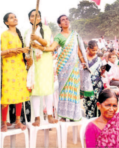
కేసీఆర్ సభలో గులాబీ జెండాతో..