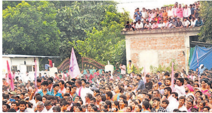
బిల్డింగ్ పై నుంచి సీఎం కేసీఆర్ ప్రసంగాన్ని ఆసక్తిగా వీక్షిస్తున్న ప్రజలు